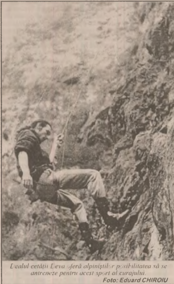
Dealul cetății Leva oferă alpiniztilor posibilitatea să se antreneze pentru acest sport al curajului.