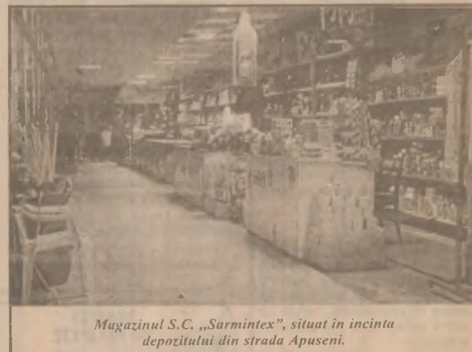
Magazinul S.C. „Sarmintex”, situat în incinta depozitului din strada Apuseni.