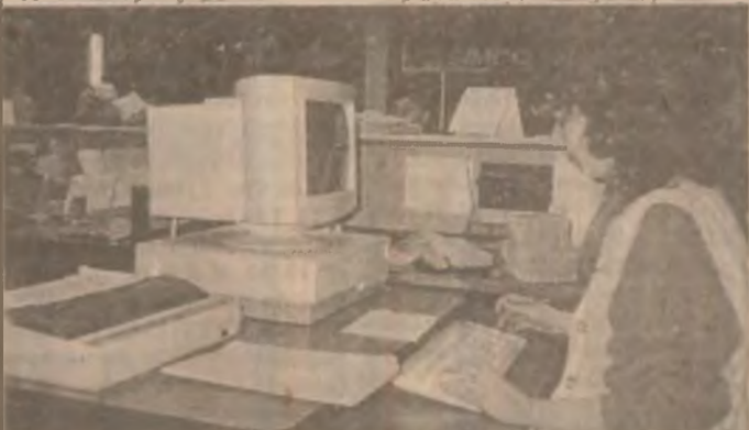
La Oficiul poștal nr. 1 Timișoara informatizarea prestațiilor la ghișee a devenit o realitate.

Potrivit intențiilor exprimate de conducerea regiiei, se are în vedere ca până la sfârșitul acestui an să beneficieze de o dotare asemănătoare toate oficiile poștale urbane din țară. (N.T.)