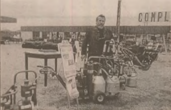
Specialistul în aparate de muls și utilaje pentru industria alimentară.

Interlocutorul spunea că are în lucru în prezent șase proiecte pentru fabrici de prelucrare a laptelui și instalații de muls mecanic. Important de relevat este și faptul că, la cererea solicitanților, beneficiarii ai unor astfel de utilaje, se efectuează probe de lucru la locul de producție, respectiv la domiciliul clientului oferind astfel garanții că s-a realizat o afaceri bună din partea cumpărătorului.