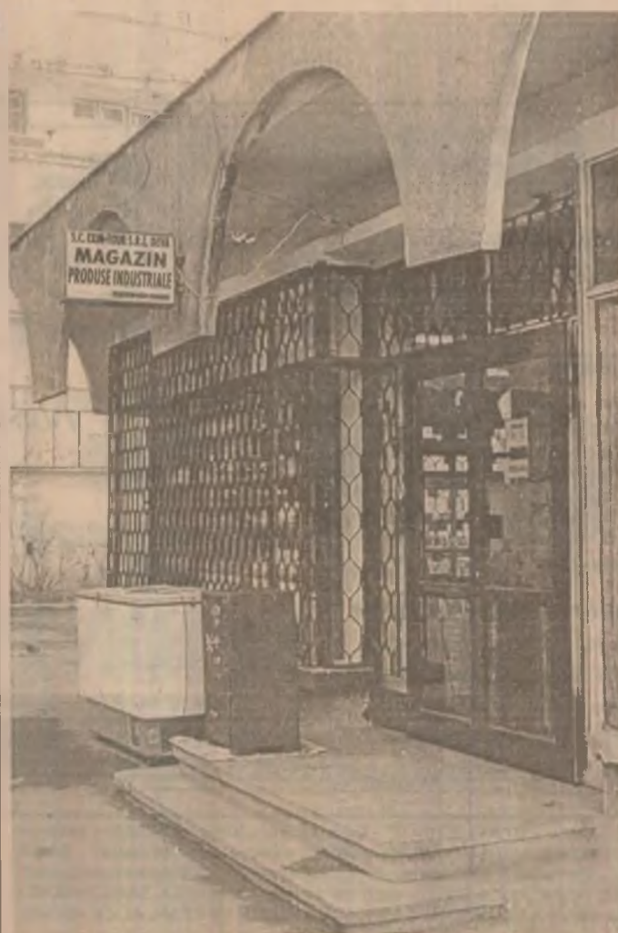
Noul magazin de produse industriale deschis la Deva, lângă Exim-Tour, pe str. Horia, nr.5, Deva.