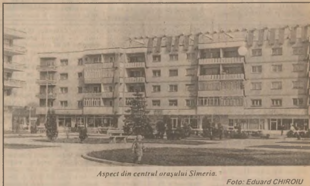
Aspect din centrul orașului Simeria.