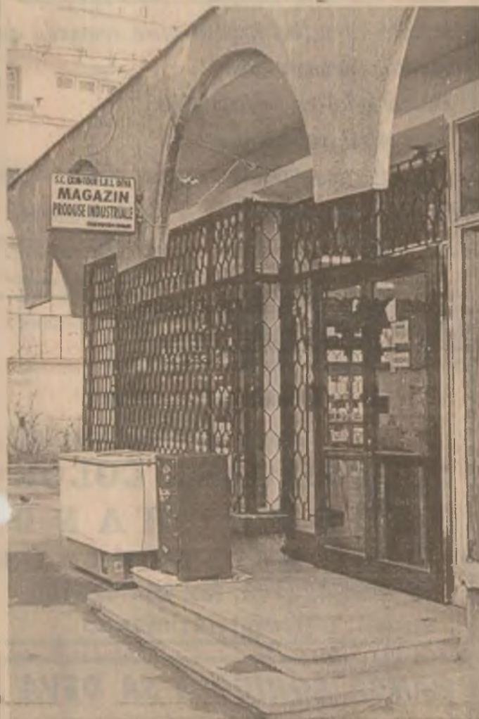
Noul magazin de produse industriale deschis la Deva, lângă Exim-Tour, pe str. Horia, nr.5, Deva.