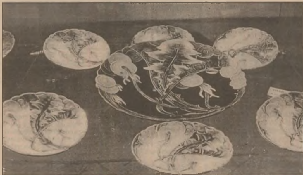
Set de farfurioare cu model floral din colecțiile Secției de artă a Muzeului Civilizației Dacice și Romane Deva.