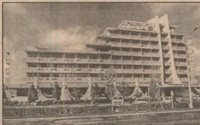
Hotelul "Deva" din municipiul reședință de județ.