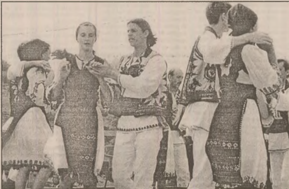
Dansatori ai ansamblului „Hațegana” al Casei de Cultură Hunedoara.