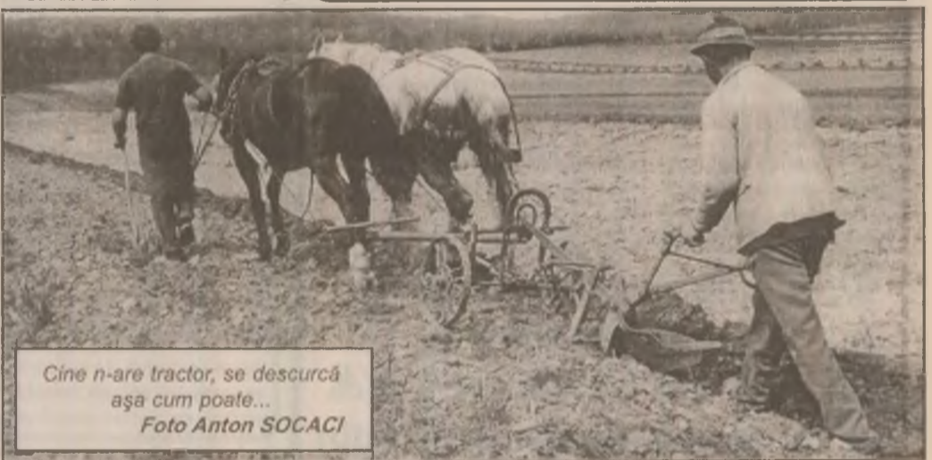
Cine n-are tractor, se descurcă așa cum poate...

Pe lângă prezentarea a o serie de substanțe chimice necesare combaterii bolilor și dăunătorilor culturilor agricole, sunt aduse în atenție probleme legate de pomi-cultura biologică, hibridii de porumb, cultura pepenilor și a legumelor în gospodărie, calendarul lucrărilor, acțiunile în vie și cramă, pregătirea pășunatului pentru animale, îngrijirea puilor de o zi, taxa pe urzici și alte subiecte interesante.