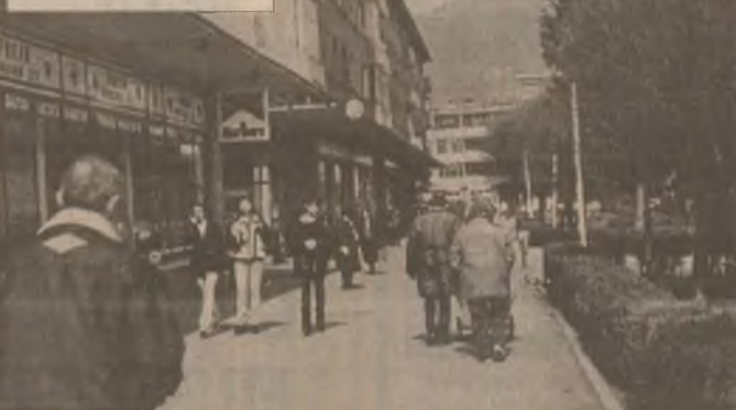
La plimbare prin centrul vechi al municipiului

Gara este locul unde niciodată nu se doarme, în sensul că aici întotdeauna se mișcă ceva, fie și numai arătătoarele ceasului de peron. Gara municipiului de reședință a județului este una dintre cele mai măndre clădiri din județ și chiar din această parte a țării. Poate puținii știu că clădirea a apărut prin grija unui om care, din păcate, a trecut în lumea de dincolo, fără știința conducerii superioare a partidului comunist. Gara Devei are ceasurile ei de zi, precum și ceasurile de noapte, iar acestea din urmă sunt foarte interesante. Să punctăm câteva repere ale acestora.