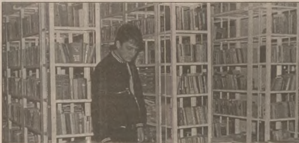
Cele 60.000 de volume, câte se află pe rafturile Bibliotecii din cadrul Clubului "Constructorul" OT, fac din această instituție un adevărat sanctuar de spiritualitate.

Prin bunăvoința dnei Magdalena Popa, lucrător gestionar în cadrul Administrației piețelor Hunedoara, am notat prețurile în această săptămână ale celor mai semnificative produse: cartofi: 3000-3500 lei/kg; ceapă: 7500 lei/kg; fasole uscată: 5000 lei/kg; morcovi: 2000 lei/kg și 4000 lei/kg în amestec cu pătrunjel; salată verde: 1000-1500 lei/buc; spanac: 5000 lei/kg; ceapă verde: 1000-1500 lei/leg; usturoi verde: 2000 lei/leg; ridichi: 1500-2000 lei/legătură; telemea de oi: 28.000 lei/kg; brânză dulce de vacă: 20.000 lei/kg; smântână: 20.000 lei/kg; ouă: 700-1000 lei/buc.; lapte: 3000-3500 lei/litru.