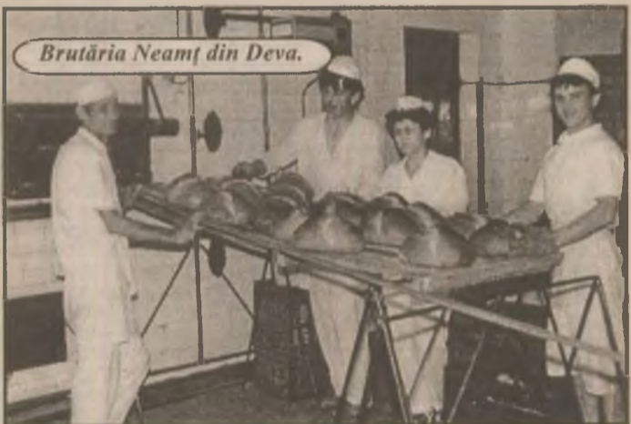
Brutăria Neamț din Deva.