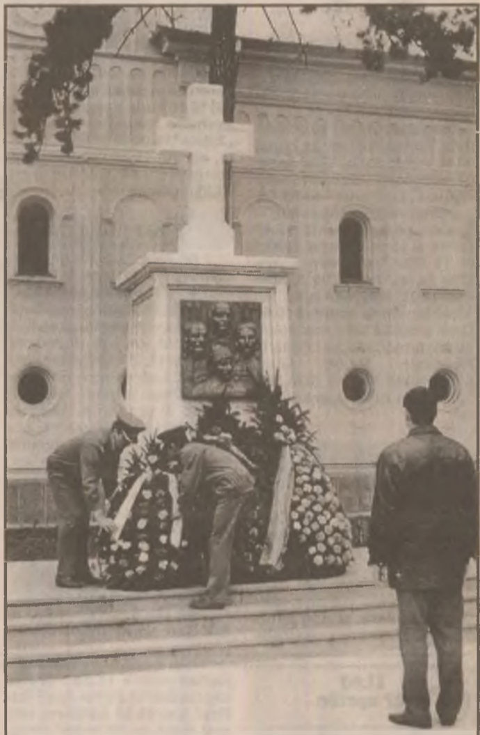
Cu prilejul Zilei Trupelor de Uscat, la Catedrala Sf. Nicolae din Deva a avut loc ceremonia depunerii de coroane.