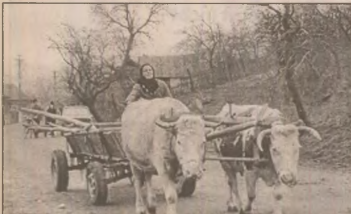
Se poate intra și așa în Europa?