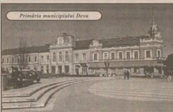
Primăria municipiului Deva

• Două legi promulgate. Președintele României, Emil Constantinescu, a promulgat, în cursul săptămânii trecute, două importante legi economice: Legea privind operațiunile de leasing și societățile de leasing și Legea de aprobare a Ordonanței nr. 26/1997 privind modificarea Ordonanței nr. 15/1996 privind întărirea disciplinei financiar-valutare.