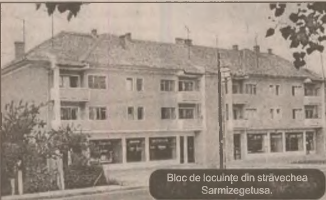
Bloc de locuințe din străvechea Sarmizegetusa.

Nu numai în cazul legumelor cultivatorii au avut surpriza să nu răsără semințele cumpărate de la diverși și falși producători, ci și unii cultivatori de plante furajere. Iată de ce este important ca fiecare cultivator să aibă permanent în atenție grija față de calitatea semințelor folosite, mai ales în condițiile de azi când prețul acestora este așa cum este. (N.T.)