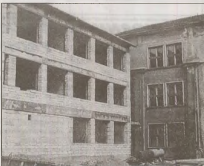
Deși contractul referitor la construirea clădirii de extindere a Liceului Teoretic "Iancu de Hunedoara" prevede finalizarea lucrărilor în 18 luni, șantierul deschis în urmă cu patru ani de zile e, în continuare, în lucru...

Singura unitate de optică medicală, care colaborează cu medicul oftalmolog, este S.C. Tehno Optica SRL. Vine astfel în sprijinul populației, care are nevoie de control și de prescripție medicală. Cum am aflat, în ultima vreme tot mai multe persoane, atât copii cât și adulți, sunt purtători de ochelari de vedere. Pe de altă parte, se solicită și ochelarii de soare, foarte moderni. Unitatea nu duce lipsă de aceste articole, având foarte mulți furnizori, cei mai mulți ofertanți de rame și lentile din import. Comenzile sunt