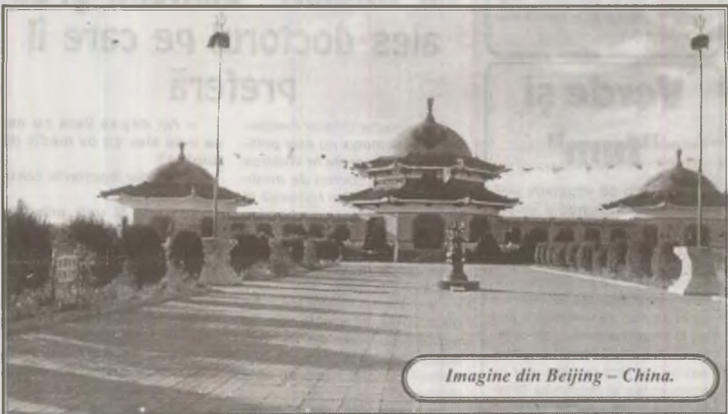
Imagine din Beijing - China.

Instalațiile termonucleare, asemănătoare celui utilizat luni de India sau cele cu plutoniu, cum a fost cea testată de India în 1974, constituie arme de distrugere în masă, ce pot fi utilizate împotriva infrastructurilor, a subliniat Srinivasan.