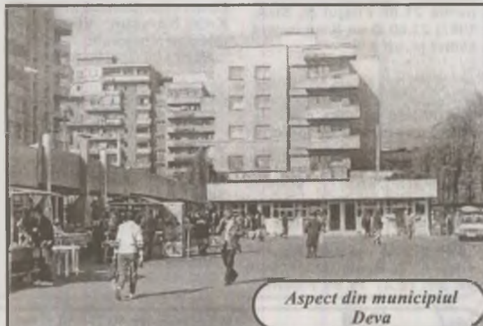
Aspect din municipiul Deva

La Hunedoara, în același interval, va fi deschisă pentru onorarea rețetelor farmacia "Alfa", situată în zona complexului "Gambirinus", telefon 722593. (E.S.)