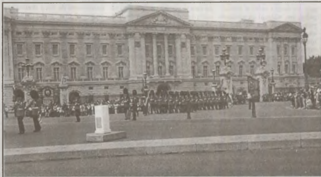
Schimbarea gărzii la palatul Buckingham din Londra.

48, condus de cetățeanul de origine turcă Senger Gökmen, care a dispărut de lângă vehicul, pe care l-a abandonat. Organele vamale au predat cazul Poliției, în vederea continuării cercetărilor.