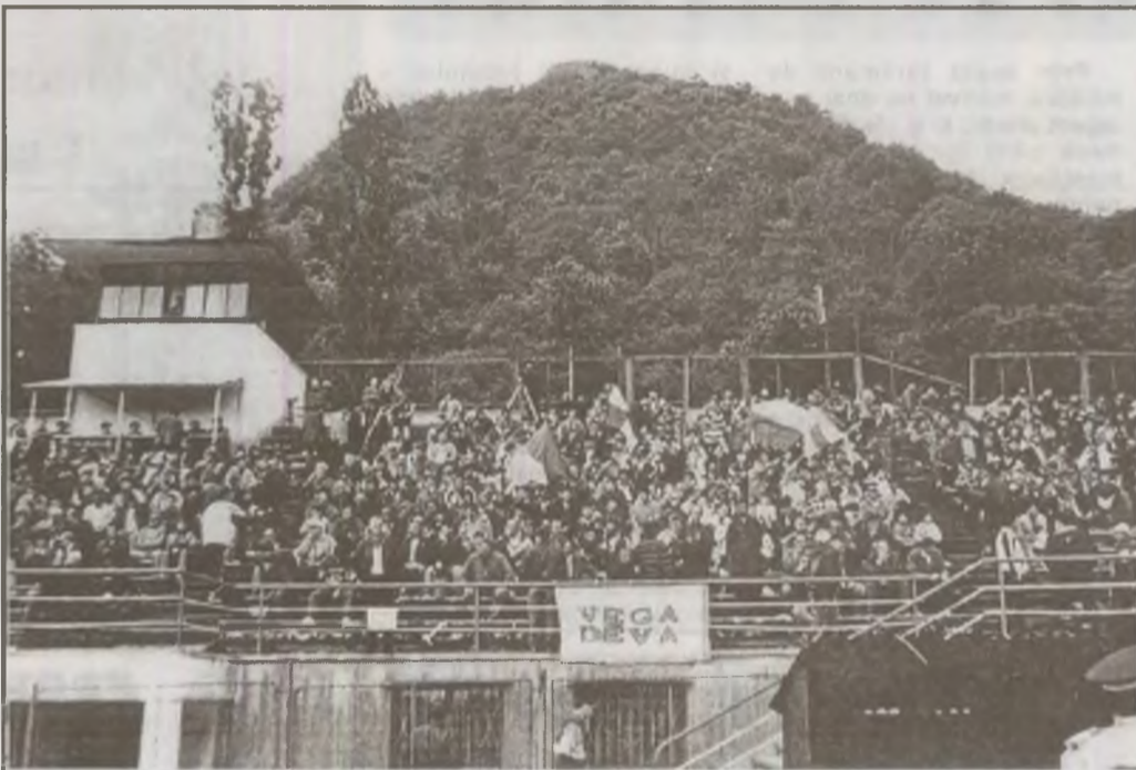
Și la meciul Vega Deva - Politehnica Timișoara, stadionul "Cetate" a fost arhiplin. Și de această dată, devenii au dat satisfacție suporterilor lor.