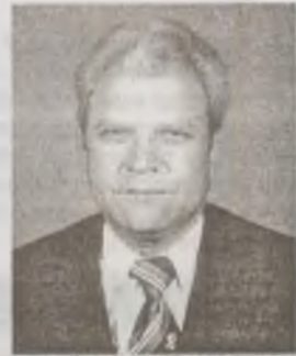
plit.adj. (r) KIS TOIH (POALY)

• Veșnic nemângâiați soția, fiica, ginerele și nepoata anunță trecerea unui an de la dispariția celui care a fost