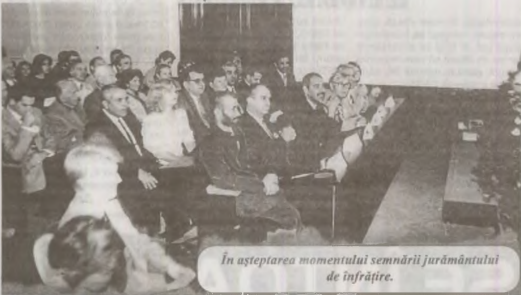
În așteptarea momentului semnării jurământului de înfrățire.