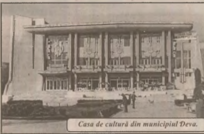
Casa de cultură din municipiul Deva.

În această lună pensionarii din Deva vor avea o plăcută surpriză când vor trece pragul Casei de Ajutor Reciproc pentru a-și achita cotizațiile și contribuțiile sau pentru a face împrumuturi. Casieria îi va primi într-un local nou, cochet, curat, trainic, construit în această primăvară. O sală de așteptare spațioasă, cu locuri pentru odihnă, cu ziare și reviste, le va face popasul agreabil, iar serviciile de la ghișee vor fi în ton cu ambianța noului local. (L.L.)