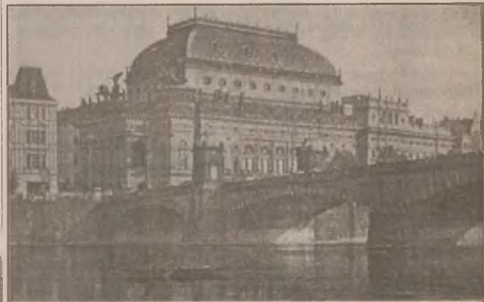
Praga - Teatrul National

"Continuăm să sperăm și vom exercita presiuni amicale asupra premierului Netanyahu, pentru ca acesta să înțeleagă că orice amânare a acestei decizii duce la creșterea pericolului în zonă și că securitatea statului evreu depinde de pacea în regiune", a mai declarat Chirac.