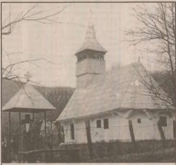
Biserica din localitatea Căbești (Brănișca) - monument istoric.