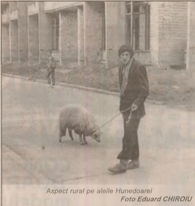
Aspect rural pe aleile Hunedoarei

murile în zonele deconectate. ROMGAZ a luat hotărârea de a realimenta blocurile cu datorii în momentul achitării unei treimi din datorii cu obligația ca până la finele lunii întreaga datorie să fie stinsă. Sistarea gazului a fost de natură să precipite achitarea obligațiilor financiare către ROMGAZ. În primele două zile de la întreruperea alimentării cu gaz s-au încasat de la datornici 60 de milioane de lei. Din cele declarate de interlocutoarea am reținut că la Hunedoara, în câteva blocuri din centrul civic, s-a trecut pe sistemul contorizării consumului de gaz pe fiecare apartament. S-a făcut precizarea că aparatul de contorizare este proprietatea regiei, celelalte cheltuieli revenind beneficiarilor.