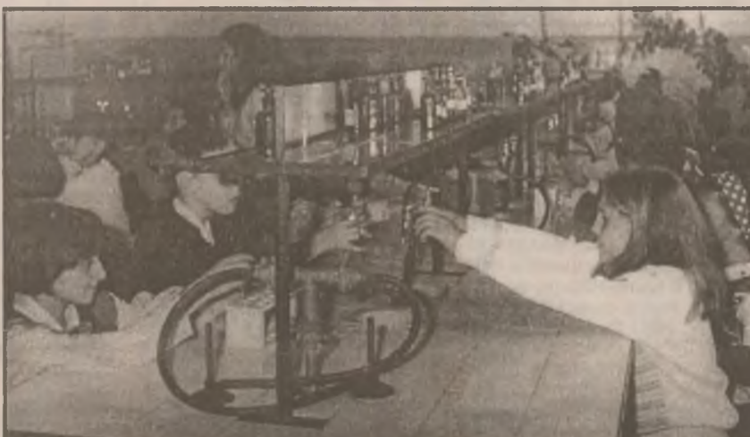
Oră de laborator la chimie la Școala „Andrei Șaguna” Deva.