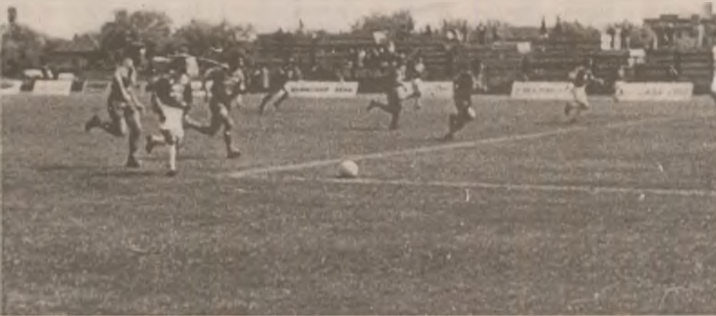
Un nou atac al fotbaliștilor de la Vega Deva spre poarta lui Roșca.