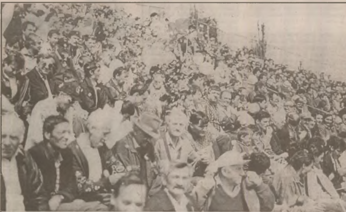
Și la ultima partidă Vega Deva - Gaz Metan Mediaș, spectatorii au umplut tribuna stadionului "Cetate", aplaudând victoria favoriților lor.

Pe locul al treilea al acestui concurs s-a clasat tot o atletă din America, Amy Acuff, cu 1,92 metri, iar locul al treilea a fost ocupat de Alina Astafei (Germania).