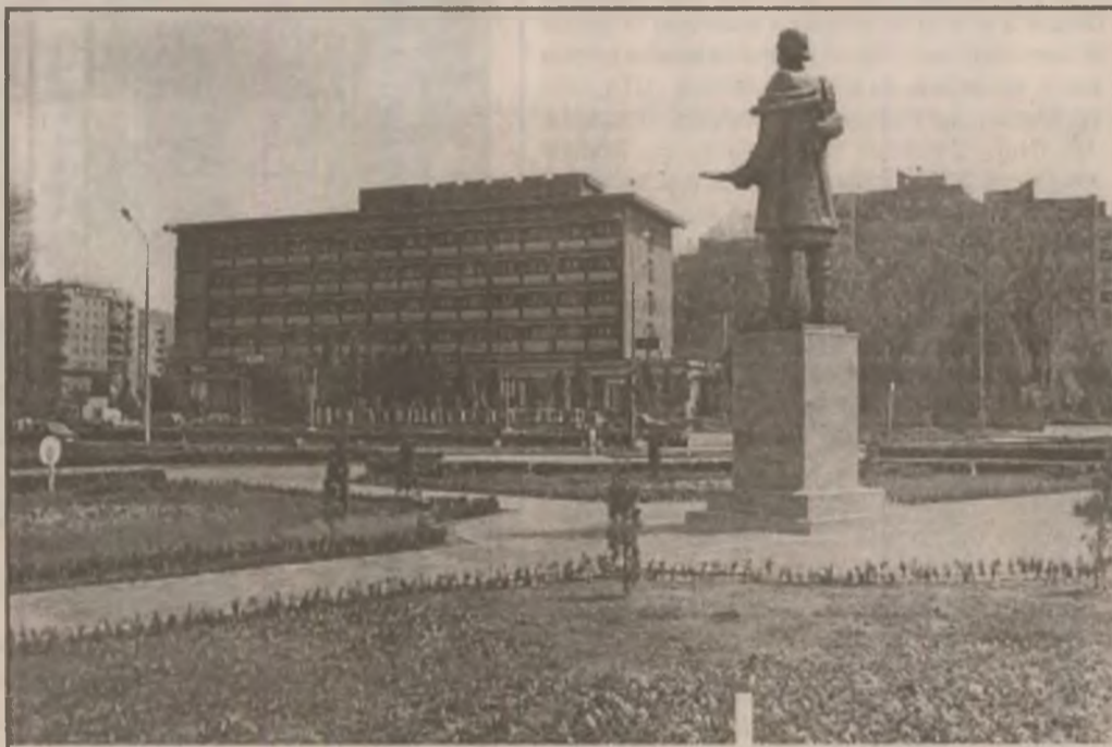
Vedere spre hotelul "Rusca" din Hunedoara.