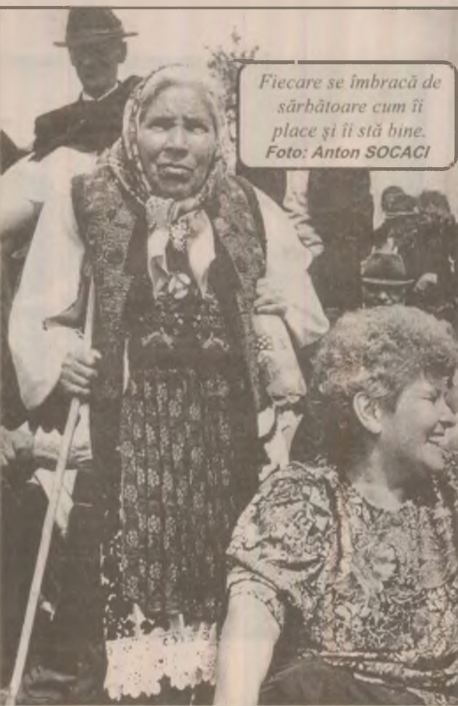
Fiecare se îmbracă de sărbătoare cum îi place și îi stă bine.