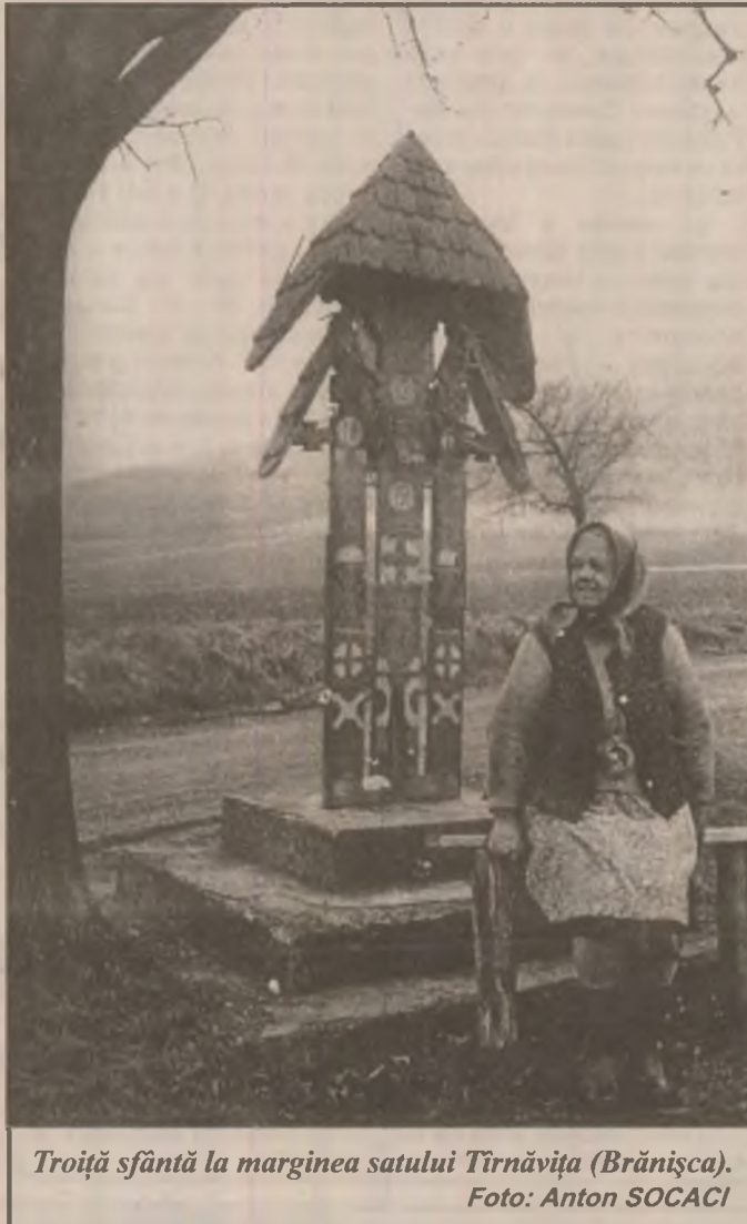
Troiță sfântă la marginea satului Tirnăvița (Brănișca).

tele Constantinescu se găsea prin Canada, iar premierul era plecat peste hotare să ne racordeze la magistralele de petrol și gaze transeuropene, iată că ministrul industriilor și comerțului, dl Radu Berceanu, reaprinde chibritul și dă foc, după o lună de la instalare, atmosferei, parcă și așa mereu în stare incendiară, instalată după înțelegerile intervenite în cadrul consiliului de coordonare politică al coaliției - așa numitul CoCoPo. Gâlceava a izbucnit după ce dl Berceanu a încălcat protocoalele și algoritmul, schimbând consiliile de administrație de la RENEL,