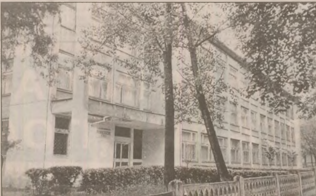
Noul Liceu de Informatică din Hunedoara