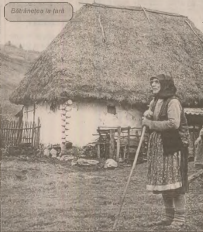
Bătrânețea la țară