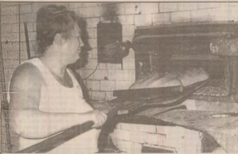
Iarnă sau vară, excitațiile îndură d.g. area cupt. arel r pentru a ne bucura noi de aroma proaspătă a pâinii

Cura exclusivă înseamnă consumarea zilnică, timp de 3 zile, în loc de mâncare, a unei cantități de până la 2 kg de căpșuni. Se bea apă minerală. Curele pot fi reluate în fiecare lună sau din două în două luni și contribuie la întărirea și remineralizarea organismului, purificarea și fluidizarea sângelui, favorizarea tranzitului intestinal și eliminarea oxizurilor, creșterea diurezei ș.a.