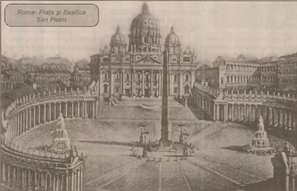
Roma - Piața și Basilica San Pietro

Autoritățile române și cele de la Vatican negociază o eventuală vizită a Papei la București încă din 1993. Atât fostul președinte, Ion Iliescu, cât și cel actual, Emil Constantinescu, au făcut în acest sens invitații oficiale, dar conducerea BOR a precizat, de fiecare dată, că momentul ales este considerat inoportun. La rândul său, Papa Ioan Paul al II-lea, invitat la București și de Conferința Episcopală Catolică din România, a preferat până acum să-și amâne decizia unei asemenea vizite, în așteptarea îmbunătățirii relațiilor dintre Biserica Ortodoxă și cea Greco-Catolică.