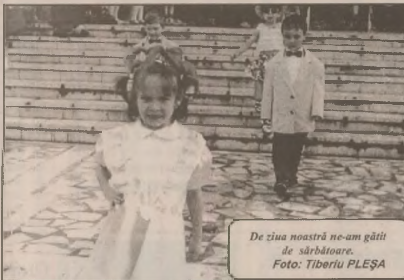
De ziua noastră ne-am gătit de sărbătoare.

În altă ordine de preocupări, Comisia Fulbright lansează o invitație la sesiunea anuală de orientare pentru elevii, studenții și absolvenții români care vor studia în Statele Unite, în anul universitar 1998-1999. Sesiunea este organizată la Centrul Cultural American din București, în ziua de 10 iulie a.c. Cu acest prilej se oferă detalii privind regimul vizelor în SUA, mediul universitar american, modul de viață, stresul intercultural, adaptarea la cultura americană. Cei interesați vor confirma participarea la telefoanele 2524449, 2526913 sau direct la sediul Comisiei Fulbright din str. Austrului nr.15, de unde pot obține și alte informații, inclusiv privind plata taxei de 50.000 lei până la data de 3 iulie a.c., cât și la materialele informative de interes practic pe care le vor primi cu prilejul participării la sesiune. (N.T.)