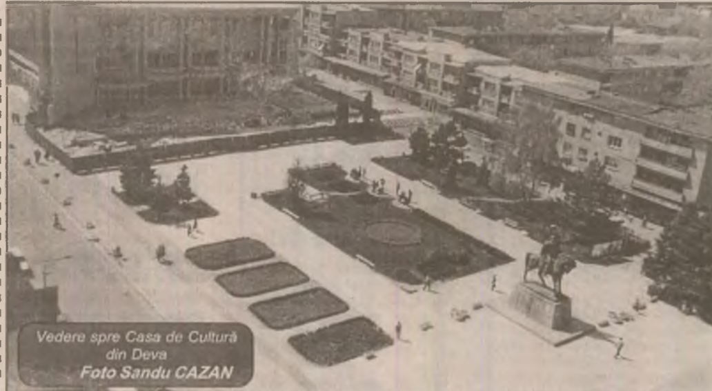
Vedere spre Casa de Cultură din Deva

DI Iosif Pogan, un vechi și statornic cititor al ziarului nostru, ne-a adus la cunoștință faptul că în unele magazine nu sunt afișate prețurile mărfurilor ce se vând. Aici, după cum cunoaștem, sunt două opinii. Prima zice că patronii au dreptul să țină prețurile ascunse fiindcă acest fapt aduce oamenii în magazine. A doua susține că, dacă omul ar vedea afișat cât costă un obiect, știind câți bani are în buzunar, vânzarea ar crește. Din cele două opinii o îmbrățișăm pe a doua.