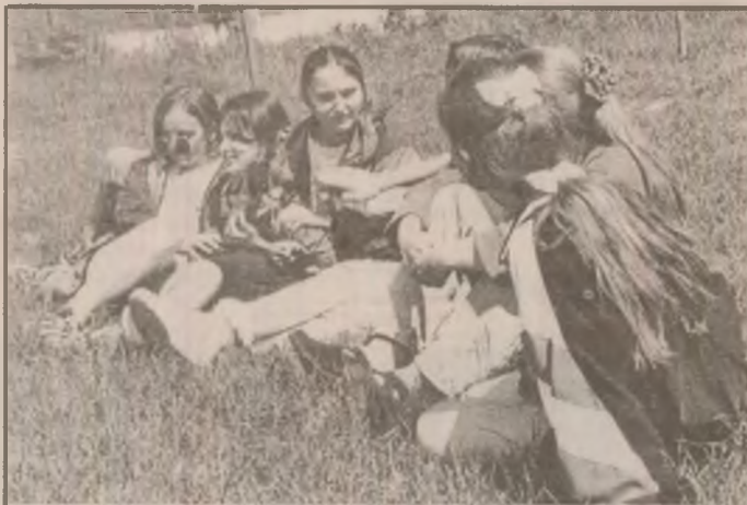
Fete de la Brânișca.