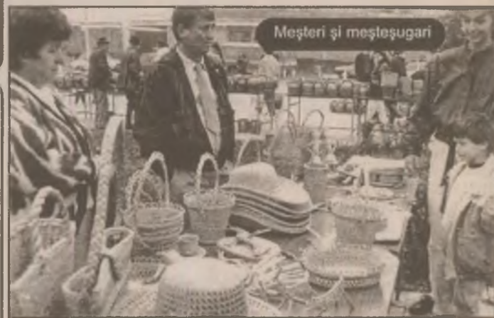
Meșteri și meșteșugari

Cât despre semnificația acestui moment, ALAIN VUILLEMIN declara că "dacă propria carte poate să devină un punct de plecare pentru noi reflecții, pentru noi întrebări, aceasta este cea mai