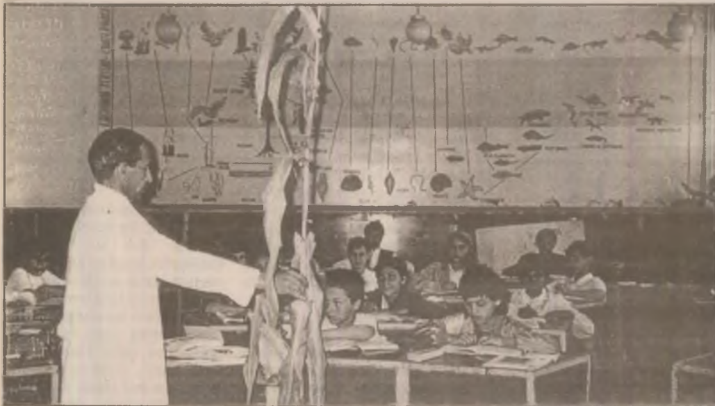
Dacă interioarele sunt "la zi" cu reparațiile, exteriorul clădirii Școlii Generale Nr.9 își așteaptă încă rândul...