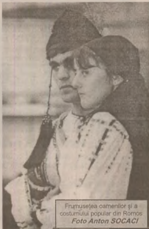
Frumusețea oamenilor și a costumului popular din România