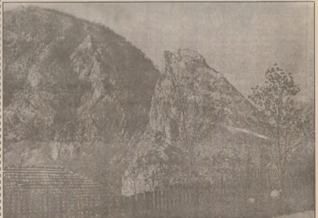
"Semeția" Munților Apuseni, stânci golașe și abrupte