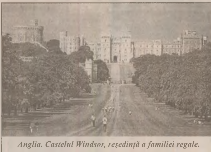
Anglia. Castelul Windsor, reședință a familiei regale.

În vederea reducerii poluării, Executivul intenționează să adopte, în cursul săptămîinii viitoare, o Hotărâre de Guvern privind reducerea cantității de plumb din benzina, a arătat Traian Băsescu.