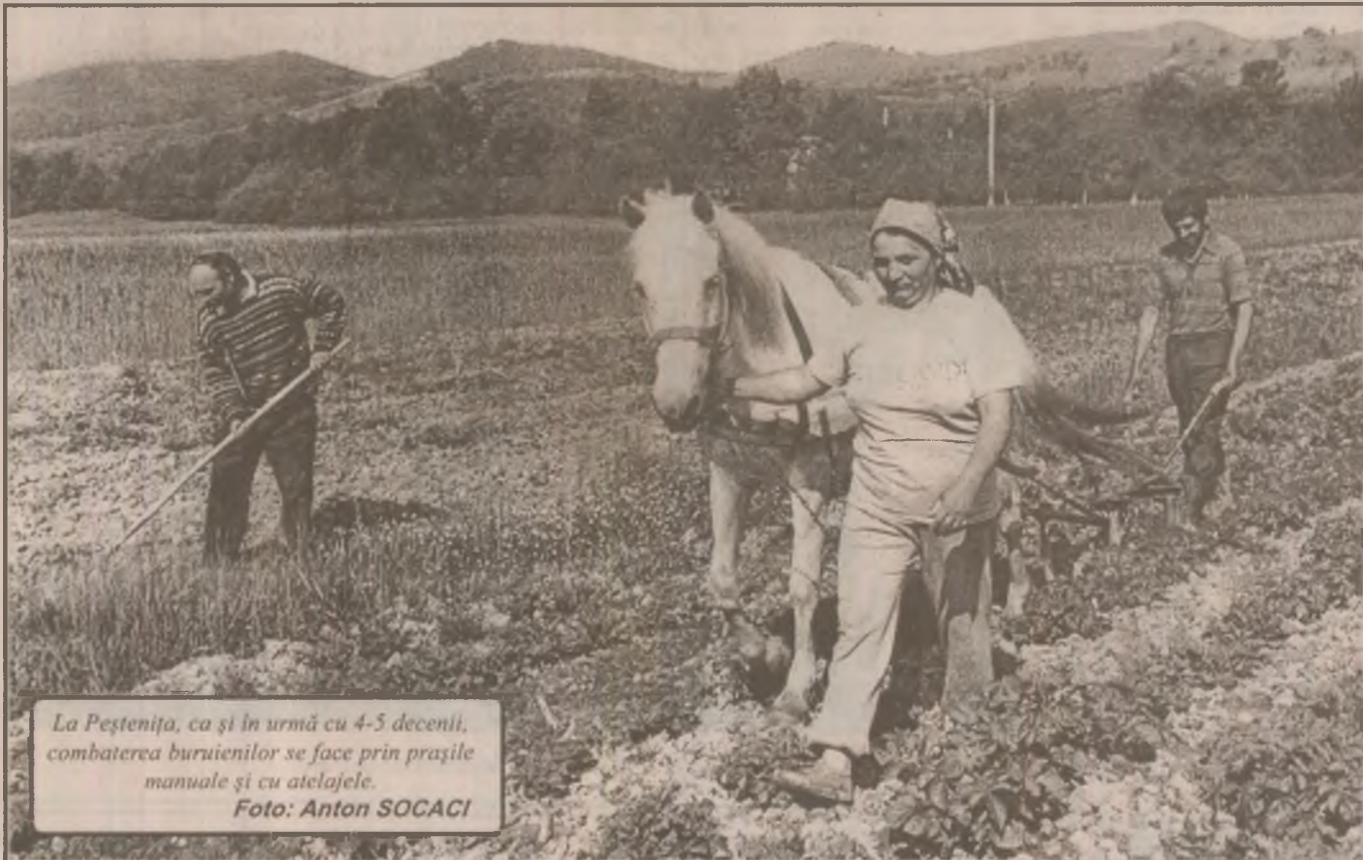
La Peștenița, ca și în urmă cu 4-5 decenii, combaterea buruienilor se face prin prașile manuale și cu atelajele.