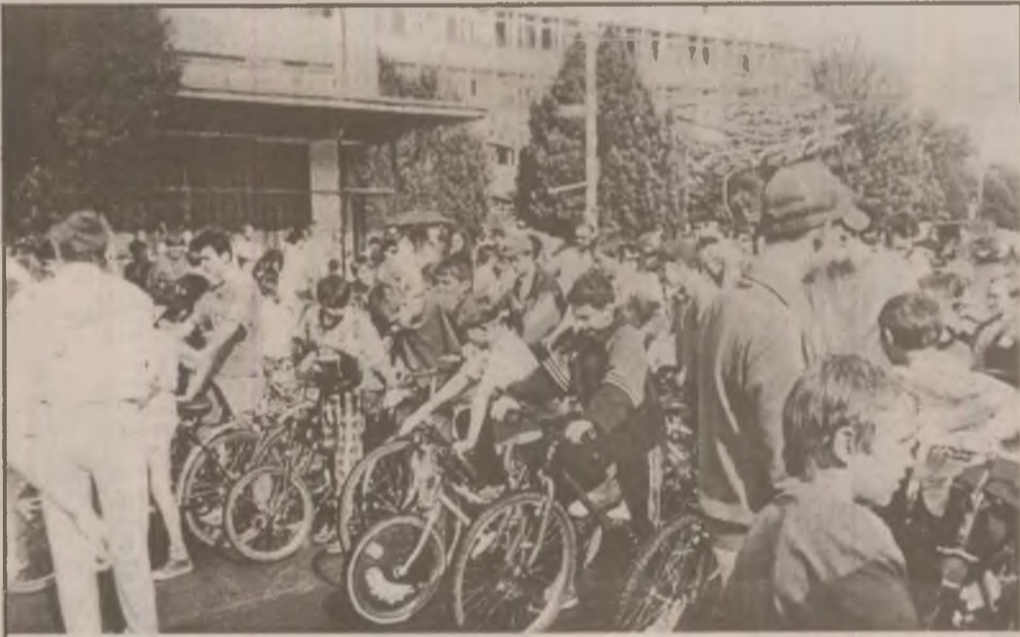
Start la un concurs de biciclete de la Deva.