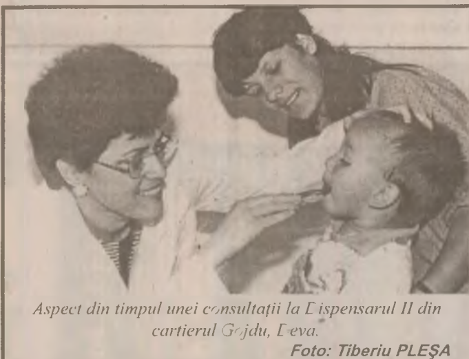
Aspect din timpul unei consultații la Dispensarul II din cartierul G-ju, Eva.

Cantitatea și calitatea podoabelor diferă în funcție de bogăția familiei, dar nu rare sunt țărăncile care poartă bijuterii splendide; ornamentele nu sunt numai corporale, în numeroase regiuni costumul fiind acoperit de broderii și oglinjoare. Indienele au o pasiune pentru bijuterii, considerându-le de bun augur. De aceea meseria de bijutier este prosperă și căutată în India.