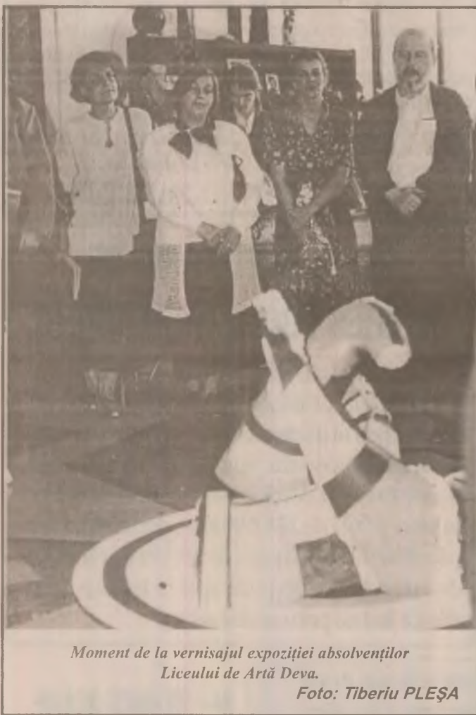
Moment de la vernisajul expoziției absolvenților Liceului de Artă Deva.