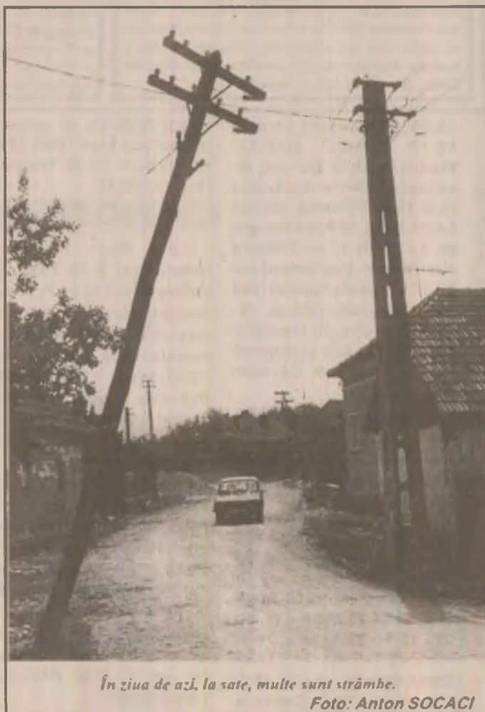
În ziua de azi, la sate, multe sunt strămbi.