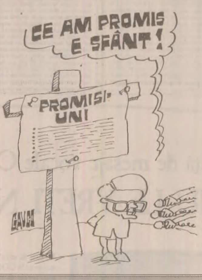
Pagină realizată de Valentin NEAGU

De menţionat că majoritatea acestor forţe care trebuie pregătite există, dar funcţionează cu anumite disfuncţionalităţi. Necesitatea lor este cu atât mai mult necesară, cu cât şi în perioada actuală se menţin stări de pericol, cauze potenţiale de incendii şi alte nereguli care pot produce evenimente deosebite.