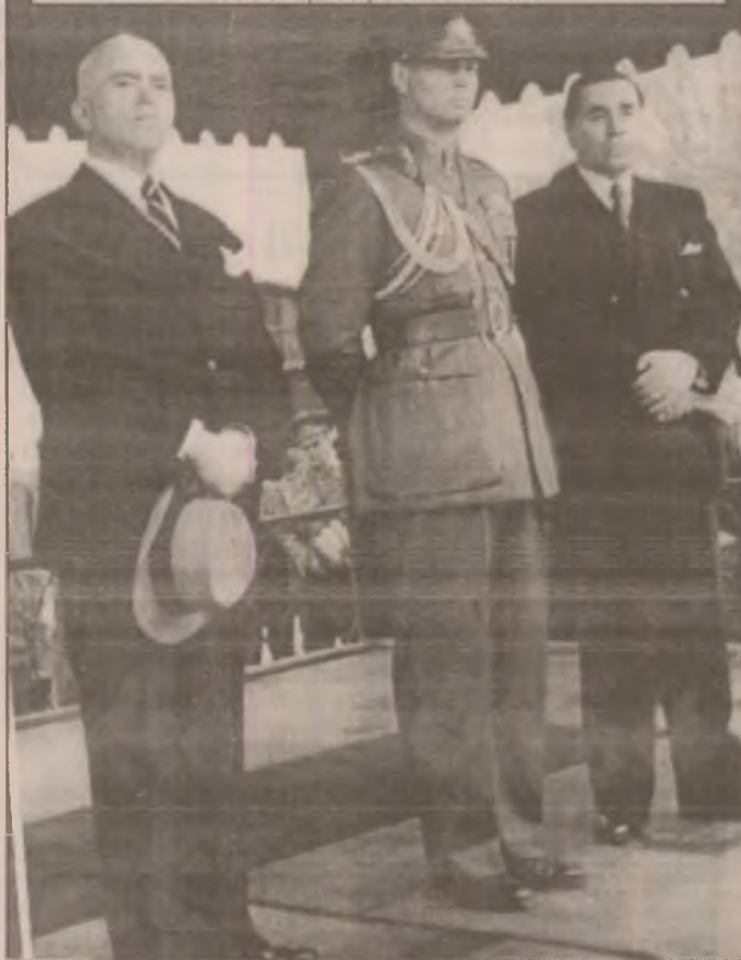
20 sept. 1946. Regele Mihai I, prim-ministrul dr. Petru Groza și șeful delegației, Gh. Tătărescu, în gara Băneasa, la întâmpinarea delegației române ce se întorcea de la Conferința de pace de la Paris.

Petru Groza a renunțat la averi și și-a pus întreaga capacitate și energie în slujba intereselor majore ale țării și poporului. Folosind momentul prielnic, el a condiționat acceptarea funcției de prim-ministru de restatutarea imediată a administrației românești în Ardealul de Nord, aflat temporar sub autoritate militară sovietică. Stalin răspunde favorabil acestei cereri și la 13 martie 1945 la Cluj se desfășoară mari festivități prilejuite de revenirea la Patria-Mamă a străvechiului teritoriu românesc. Ulterior, Groza a mărturisit: