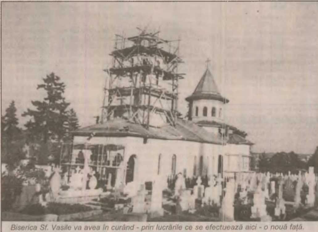
Biserica Sf. Vasile va avea în curând - prin lucrările ce se efectuează aici - o nouă față.