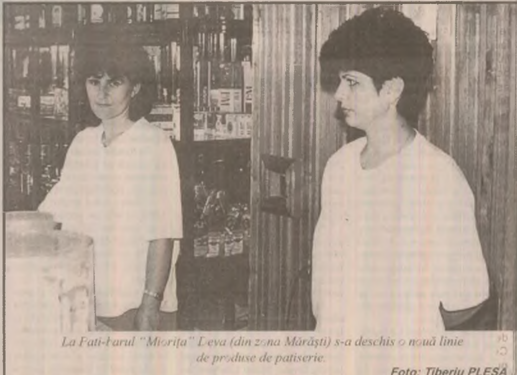
La Fati-Barul "Miorița" Deva (din zona Măraști) s-a deschis o nouă linie de produse de patiserie.

▲ Suc de castraveți cu morcovi. Câte 200 ml de suc de castraveți și de morcovi se amestecă cu zeamă de lămâie, sare, piper și mărar tocat mărunț. Se dau la rece, preparatul se servește în pahare, cu (sau fără) frișcă.