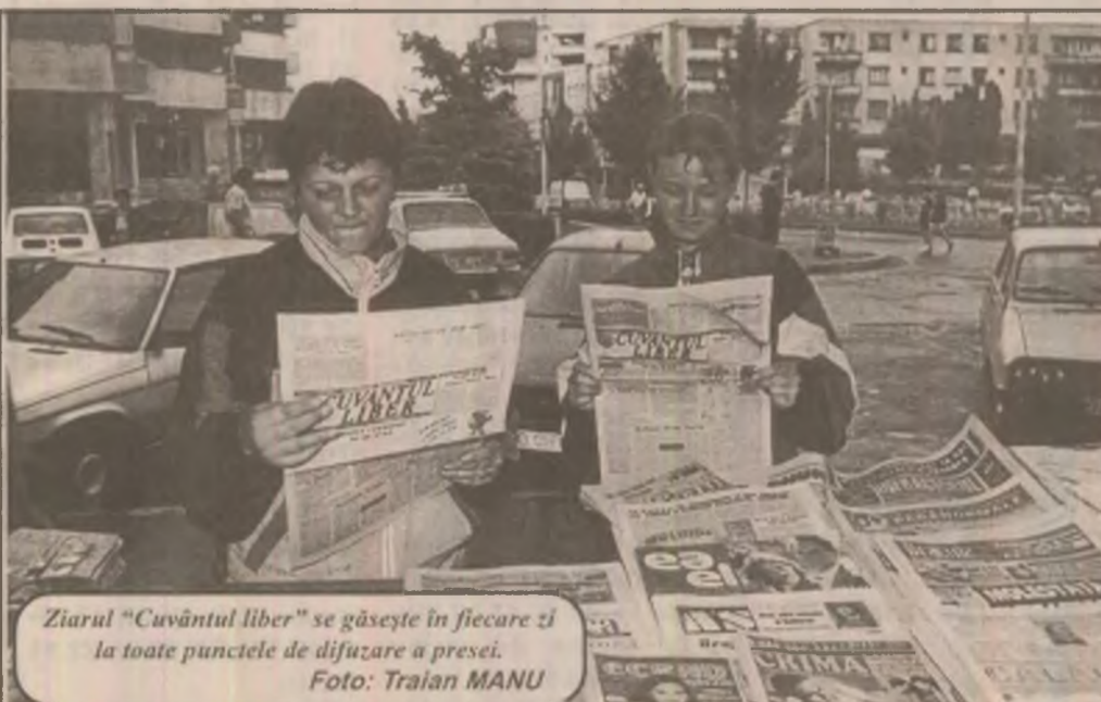
Ziarul "Cuvântul liber" se găsește în fiecare zi la toate punctele de difuzare a presei.