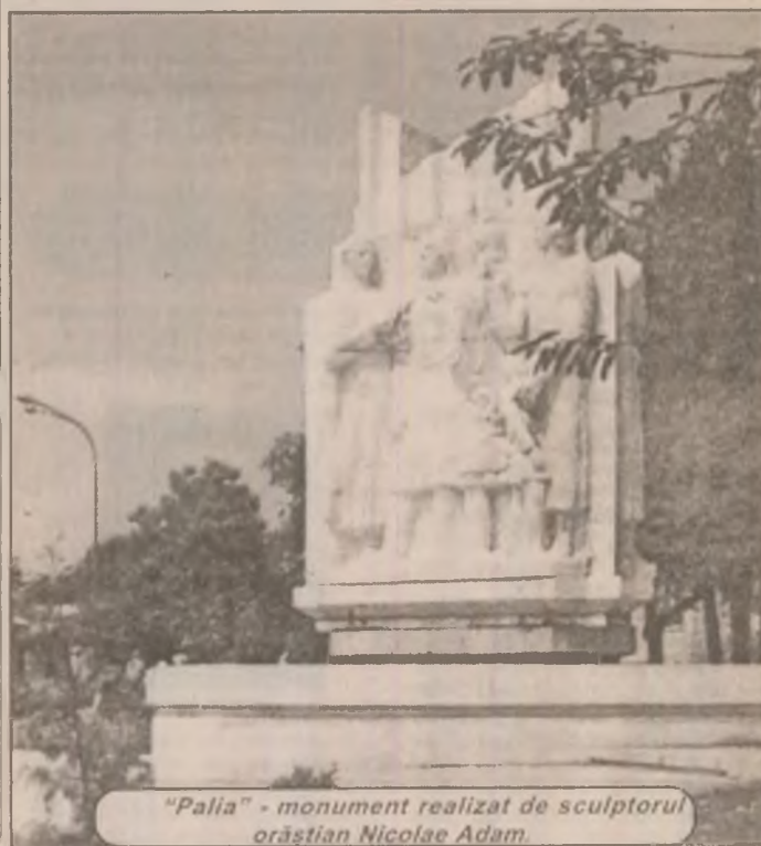
"Palia" - monument realizat de sculptorul orăstian Nicolae Adam.