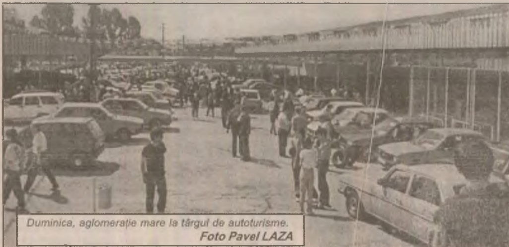
Duminica, aglomerație mare la târgul de autoturisme.