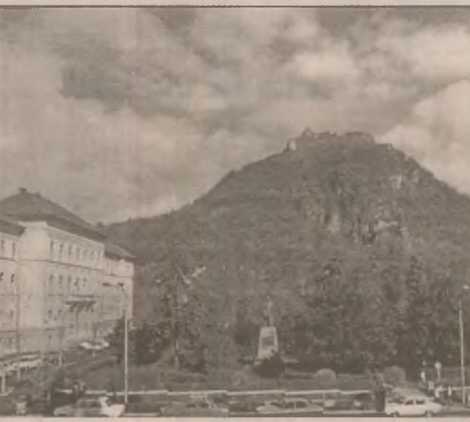
Palatul Justiției, parcul și cetatea Deveii