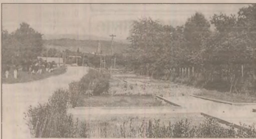
La Densuș, pe marginea străzii ce duce către „vechea biserică”, se amenajează un parc.

Nu mai aceste organe pot cunoaște condițiile concrete în care se desfășoară activitatea la fiecare loc de muncă analizat și, pe cale de consecință, pot hotărâ în problema pe care o solicitați”