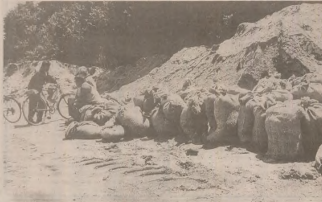
La Brâznic oamenii s-au pregătit să intervină pentru a opri intrarea apei în localitate.

În legătură cu situația inundațiilor vom reveni cu alte detalii în următoarele ediții ale ziarului nostru.