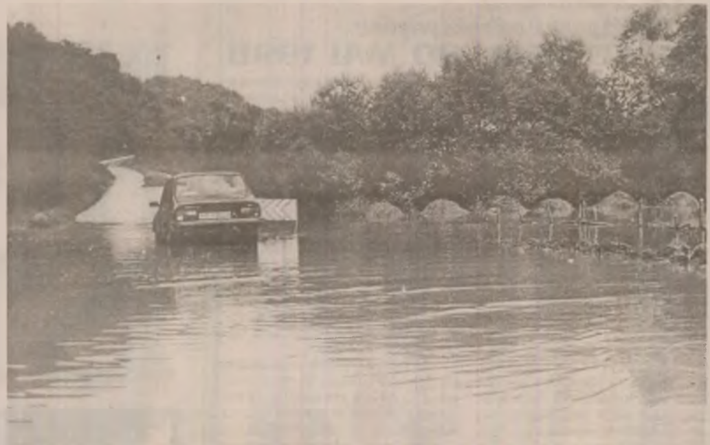
Apele învolburate, ieșite din matca râului Mureș, au făcut ca circulația pe drumul de la Lăsau spre Tisa să fie întreruptă.

Mureșul revărsat la Șoimuș, văzut de pe șoseaua Deva - Brad.