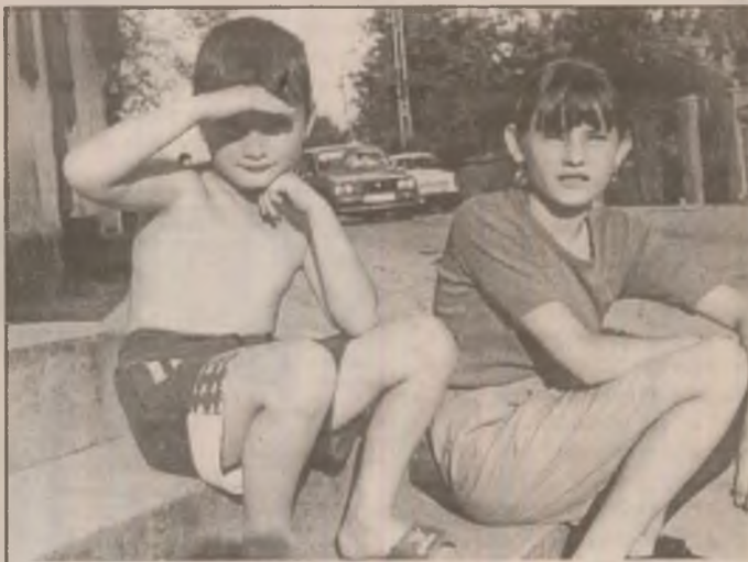
A sosit vacanța mare!