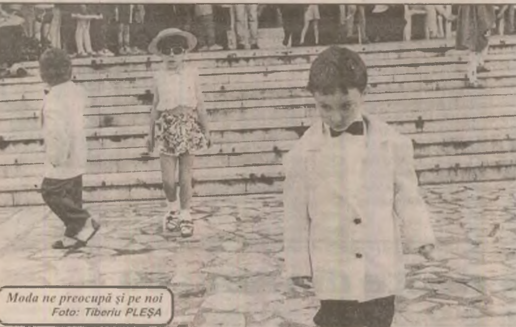
Moda ne preocupă și pe noi

P.S. Cerem scuze Manuelei pentru faptul că în pagina de "Club T" din numărul 2154/10 iunie 1998 articolul ei "Bine ai venit, vacanță!" a apărut din greșeală sub o altă semnătură.