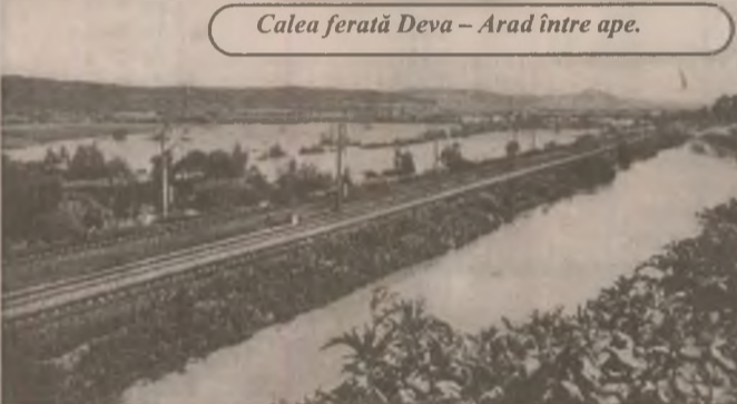
Calea ferată Deva - Arad între ape.

Dacă prin anii 1970, după inundațiile ce le-au întrecut ca și amploare pe cele de acum în unele zone ale județului, s-au început unele lucrări de regularizare și îndiguire, parcă prea repede s-au uitat urmările inundațiilor și s-a întrerupt execuția proiectelor. Ca urmare, acum din cauza depunerilor de aluviuni și ridicării albiilor râurilor, în special a Mureșului, se produc frecvent inundații de câteva ori pe an, pagubele suferite de agricultori