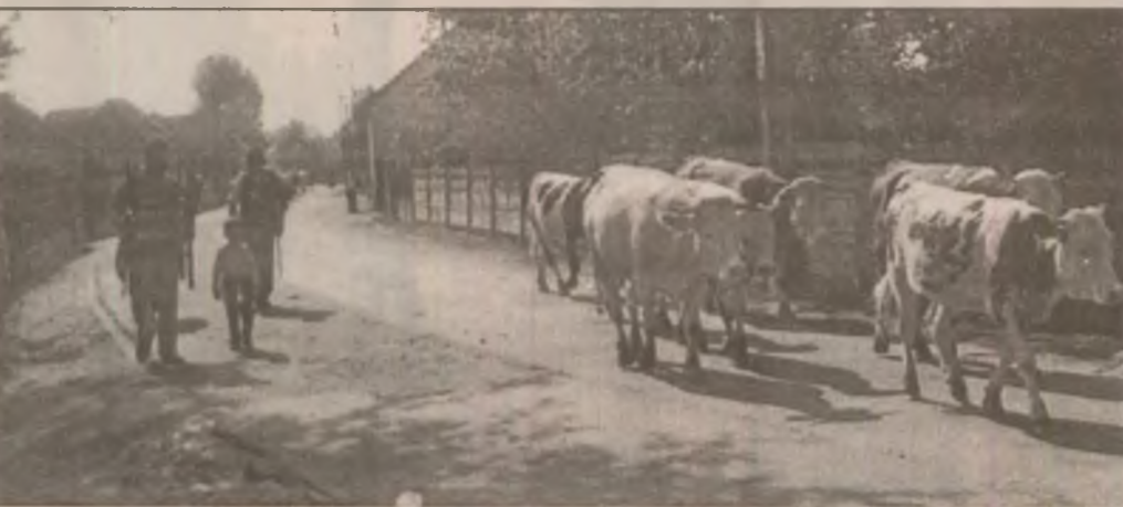
Cu animalele la pășune