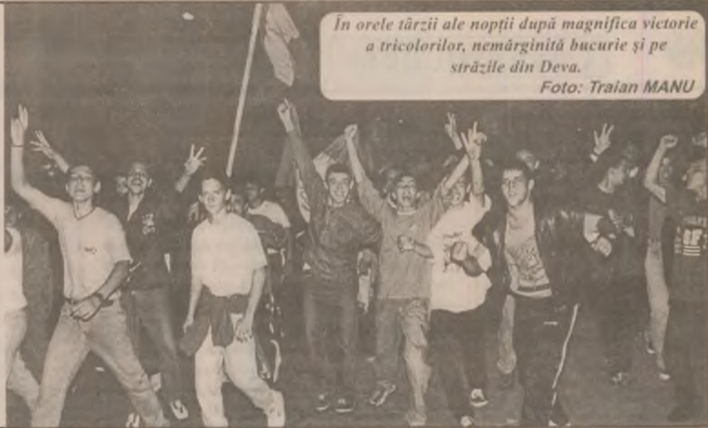
În orele târzii ale nopții după magnifica victorie a tricolorilor, nemărginită bucurie și pe străzile din Deva.