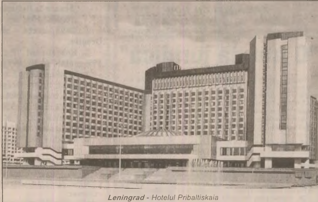
Leningrad - Hotelul Pribaltiskaia

Pentru măsurarea vitezei zborului șoimului pelerin a fost folosită o aparatură foarte sofisticată, pentru că această pasăre vânează într-un fel foarte imprezvizibil, cu schimbări bruște de direcție. Când intră în picaj, șoimul pelerin are cea mai mare viteză, stabilită la 184 de kilometri pe oră. Aceasta este cea mai ridicată valoare măsurată vreodată la o pasăre, a subliniat Observatorul Ornitologic Elvețian, care a efectuat măsurătorile.