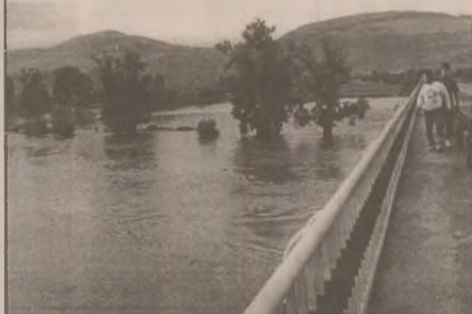
Mureșul a ieșit mult din matcă și la Șoimuș.