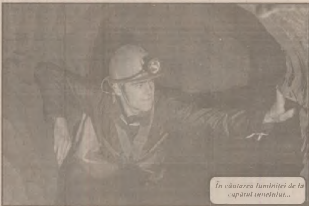
În căutarea luminii de la capătul tunelului...

principalul beneficiar, nu poate face plăți către constructorii cu specific de electromontaj, necesitatea asigurării capitalurilor circulante cerute de desfășurarea activității îndreptată filiala și spre comenzi de mai mică anvergură-branșamente, extinderea de rețele sau diferite racorduri-onorate către terți. Acestea