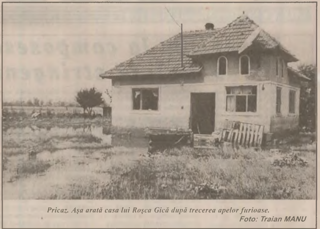
Pricaz. Așa arată casa lui Roșca Gică după trecerea apelor furioase.