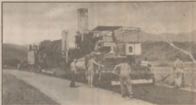
Se lucrează la repararea drumului județean BÎRSĂU - CERTEJ.