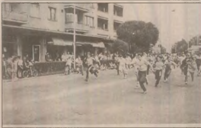
Se întrece tinerețea pe străzile Devei

adus succesul ei au realizat un album experimental în care Eddie Van Halen și-a demonstrat rafinamentul de muzician polivalent el cântând și la sintetizator. Înregistrat cu aceeași echipă tehnică Templeman/Landee albumul "Women And Children First" i-a surprins atât pe fani cât și pe critici. Albumul abundă în glume atât muzicale cât și lirice, duoul Eddie Van Halen/Roth apărând în forma maximă. Women And Children First a fost răsplătit cu platină și cuprinde piesele: And The Cradle Will Rock.../ Everybody Wants Some!/ Fools/ Romeo Delight/ Toral/ Toral/ Loss of Control/ Take Your Whiskey Home/ Could This Be Magic și In A Simple Rhyme. (-va urma-) Horia ȘEBEȘAN