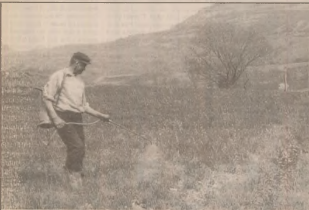
Dacă nu sunt bani și utilaje mecanice suficiente, se poate erbicida și după metode "clasice".

După amiaza, când am plecat din Geoagiu, în zonă a tăbărât o ploaie torențială, iar noaptea următoare a plouat din nou puternic în această parte a județului, așa că i-am dat dreptate dlui secretar al primăriei care afirmă că toate culturile ce s-au aflat și se află încă sub apă, sunt total compromise, spre necazul locuitorilor comunei Geoagiu, care și-au văzut din nou zădărnice eforturile depuse pe ogoare.