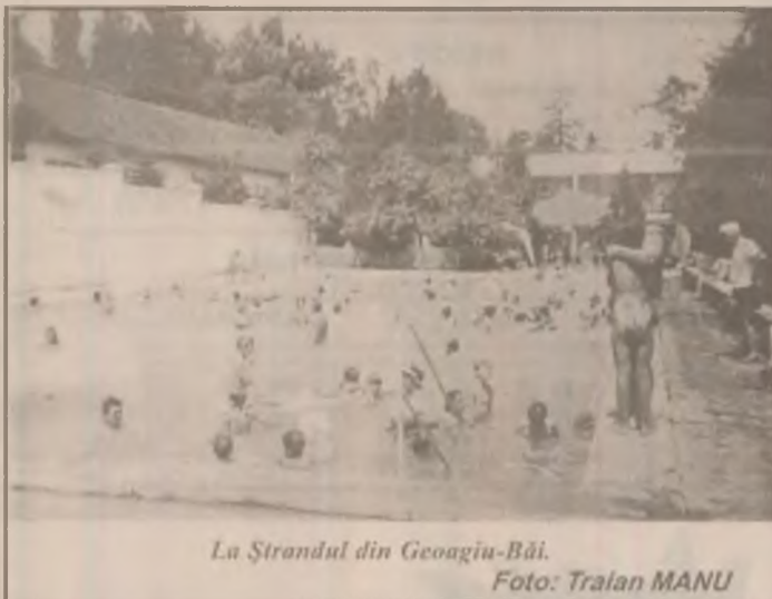
La Ștrandul din Geoagiu-Băi.

Amănunte despre discuțiile pe care le-a avut președintele ApR cu ocazia vizitei în județ cât și despre actuala stare socio-politică și economică a țării vă prezentăm în interviul acordat în exclusivitate ziarului nostru în ediția de miercuri, 8 iulie a.c. (C.P.)