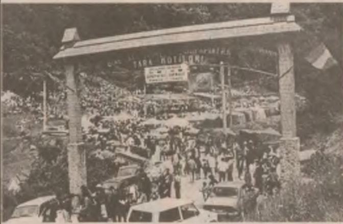
Prin această superbă poartă încrustată cu motive populare și încadrată de drapelul tricolor, am intrat duminică în ținutul legendar de la Dupăpiatră unde cotropitorilor maghiari li s-a oferit, acum 150 de ani, o lecție de patriotism, de dragoste pentru pământul strămoșesc din partea moșilor lui Avram Iancu.