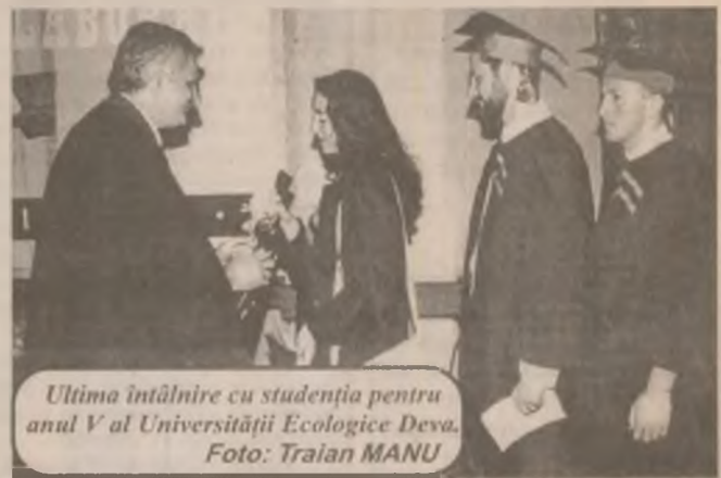
Ultima întâlnire cu studenția pentru anul V al Universității Ecologice Deva.

ultima dată, cursul de drept al profesorului Iulius Kutas. Emoțiile n-au fost vizibile însă doar în rândul studenților, ci și de partea profesorilor, care i-au asigurat pe foștii lor studenți că porțile facultății le rămân oricând deschise, dorindu-le succes la examenul de licență și toate cele necesare pe mai departe. (G.B.)