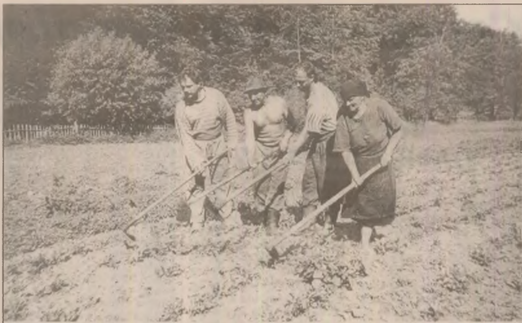
Familia Sicoe din satul Nandru, comuna Peștișu Mic, la prașila porumbului.

- Pe lângă lipsa acută de fonduri bănești disponibile pentru asigurarea unui volum de mărfuri corespunzător ca structură și calitate, necesare fiecărei unități a cooperației noastre, constatăm nu fără îngrijorare că și la populație există o acută lipsă de bani, scăderea puterii de cumpărare resimțindu-se în special în privința vânzării bunurilor de folosință îndelungată, care au o mișcare destul de lentă. Ca preocupări permanente ar fi de reținut grija ce o au conducerea unităților față de aprovizionarea magazinelor, până la cel mai îndepărtat sat, chiar și în condiții de ineficiență pentru noi, cu mărfurile de strictă necesitate, cum ar fi: pâinea, zahărul, uleiul, sarea, petrolul, pastele făinoase, încălțăminte, cuiele și altele. În ciuda neajunsurilor ce mai există, dorim să răspundem cât mai prompt cerințelor clienților noștri. Consider că astfel vom putea depăși dificultățile inerente trecerii la economia de piață, pentru ca rolul cooperației de consum să sporească, prezența noastră în viața economică și socială a satelor și a județului în ansamblul său să fie cât mai consistentă.