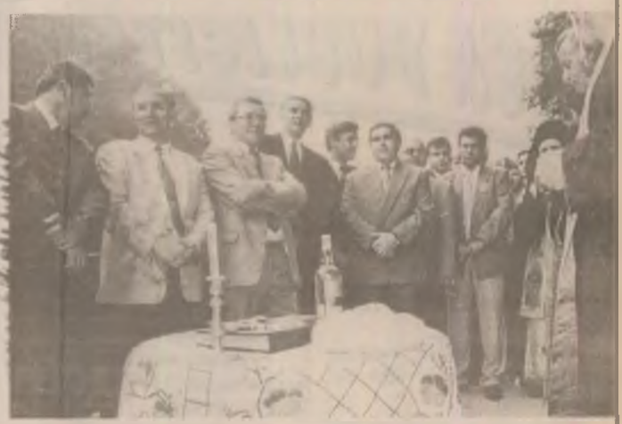
În memoria eroilor de la Dupăpiatră a fost ridicat un parastas de pomenire.