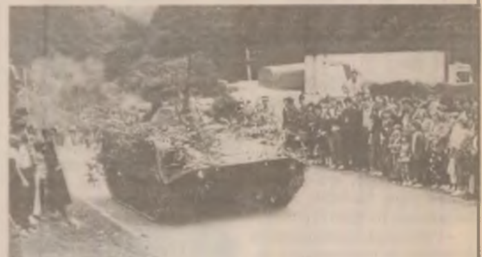
Aspect din timpul aplicației militare realizate cu participarea vânătorilor de munte de la Brad.