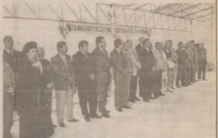
Personalități la Dupăpiatră.