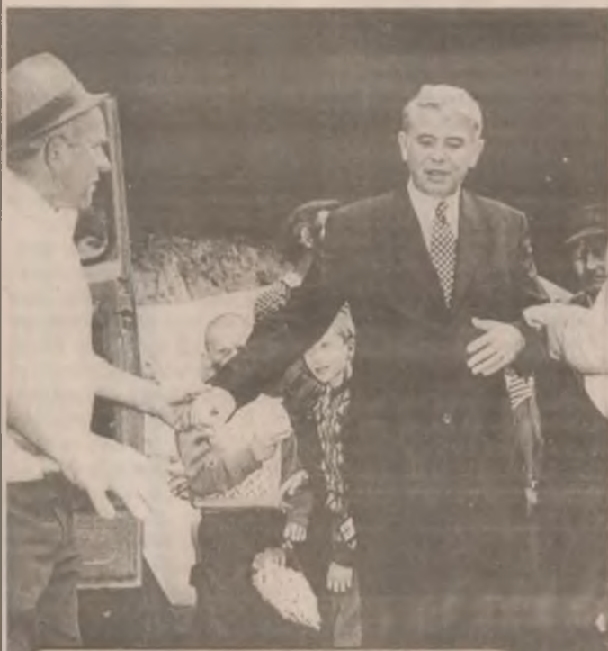
Diplomatul Theodor Meleşcanu nu și-a uitat obârșia brădeană, dialogând călduros cu olarii veniți la Dupăpiatră.