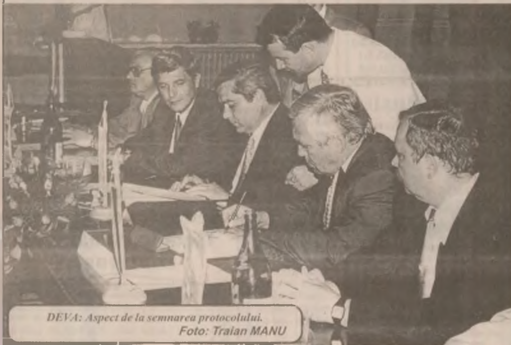
DEVA: Aspect de la semnarea protocolului.

Vineri după-amiază la Deva a avut loc ceremonia semnării protocolului de colaborare între județele Hunedoara și Vas (Ungaria), care prevede, față de anteriorul protocol, o extindere în multiple planuri a relațiilor în folosul celor două județe și al locuitorilor acestora. La ceremonie, care s-a desfășurat în prezența delegațiilor celor două județe, a participat