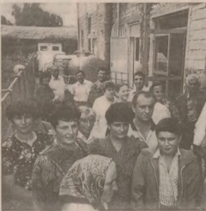
Aspect din timpul distribuirii ajutoarelor