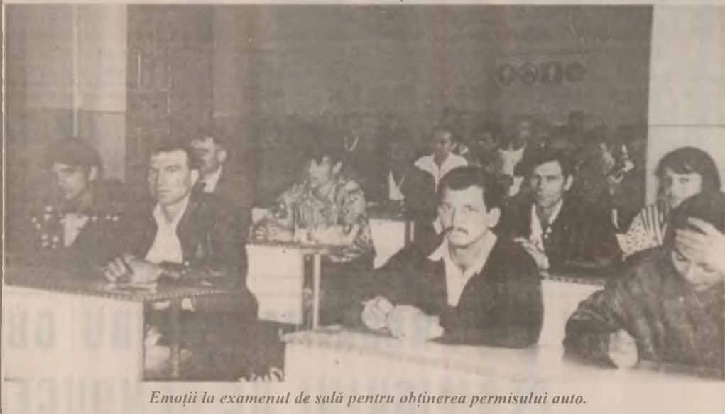
Emoții la examenul de sală pentru obținerea permisului auto.

Pentru rezultate mai bune, câțiva dintre conducătorii școlilor auto propun o zi pe trimestru în care să aibă loc întâlniri între instructori, profesorii de legislație și lucrători ai Poliției Rutiere pentru o pregătire la zi cu tot ce înseamnă noutățile în domeniul rutier cât și o mai mare exigență din partea instructorilor și a profesorilor de legislație în acordarea avizelor pentru intrarea în examen.