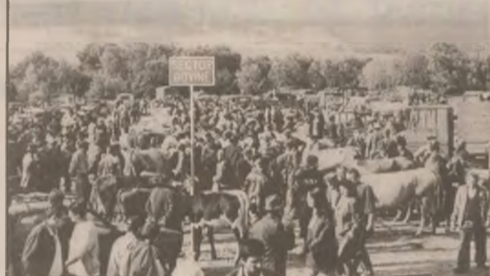
Vedere de ansamblu de la noul târg agroindustrial din satul Bejan, comuna Șoimuș, care a fost deschis sâmbăta trecută.