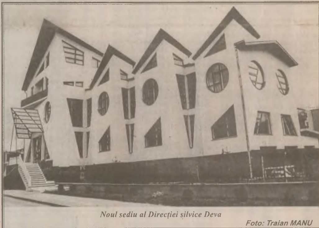
Noul sediu al Direcției silvice Deva

Văpala a fost lichidată după două ore de luptă a pompierilor unității, sprijiniți de cei militari. Important este că procesul tehnologic nu a fost afectat, producția fiind reluată cu profesionalitate de Oțelăria nr. 1. (V.N.)