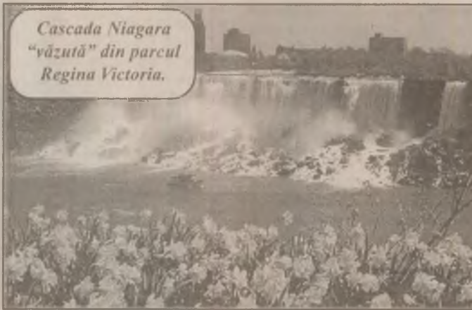
Cascada Niagara "văzută" din parcul Regina Victoria.

"Principali indicatori macroeconomici arată că situația economică nu este prea bună, iar ritmul reformelor este lent, deci investitorii nu văd de unde ar putea să vină creșterea sau profitabilitatea societăților", a spus Dumitrescu.