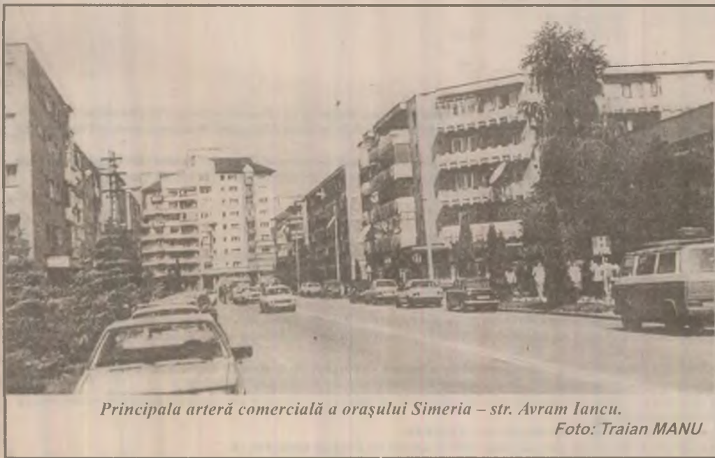
Principala arteră comercială a orașului Simeria - str. Avram Iancu.

occidentale ("2 iunie", "Brigăzile Roșii", "Ordinea Nova", IRA, ASALA), și unele structuri de tip mafiot ("triadele" chinezești, racketii ucraineni, familiile mafioate italiene sau autohtone). (MEDIAFAX)