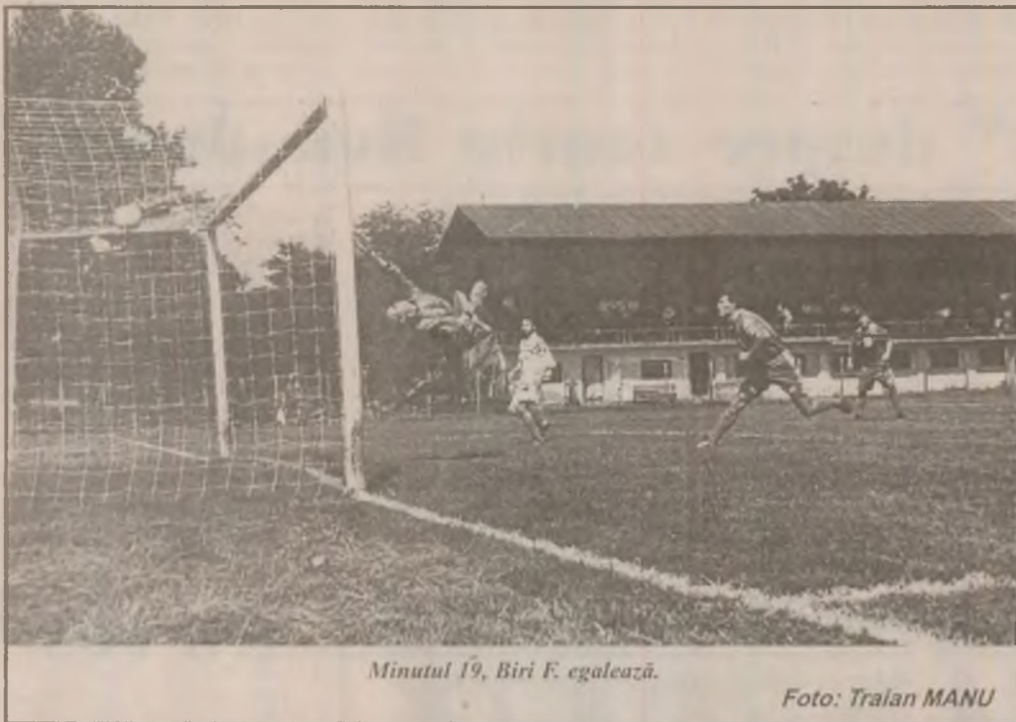
Minutul 19, Biri F. egalează.

Posibile câștiguri dintr-o afacere pe care ați considerat-o pierdută. Familia vă poate fi de mare ajutor în soluționarea unei probleme de serviciu căreia nu-i dădeați de cap.