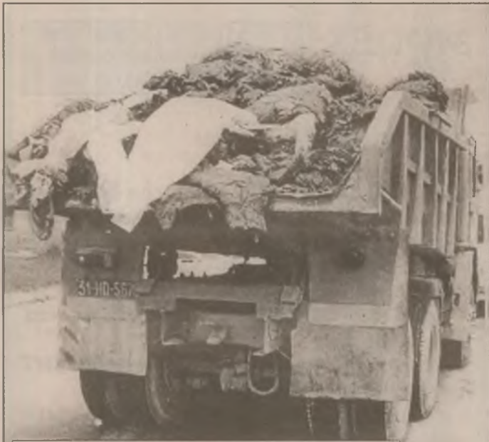
Pe șoseaua ce leagă Hunedoara de Sintuhaln, conducătorul autovehiculului 31HD5879 a pierdut pe carosabil o parte din încărcătură.