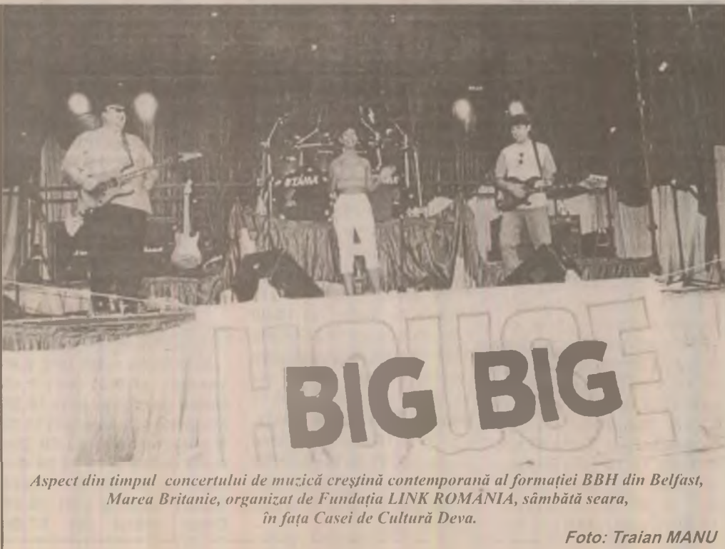
Aspect din timpul concertului de muzică creștină contemporană al formației BBH din Belfast, Marea Britanie, organizat de Fundația LINK ROMANIA, sâmbătă seara, în fața Casei de Cultură Deva.