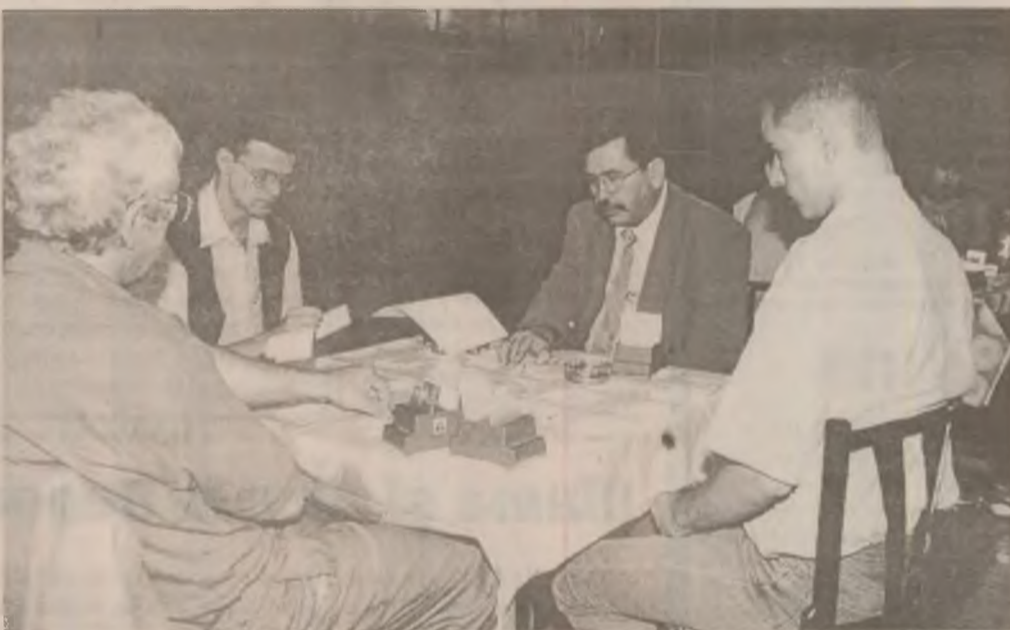
Cupa CETĂȚII la bridge, o reușită competiție sportivă.