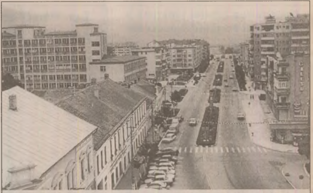
Panoramă a orașului Hațeg, în al cărui centru coexistă vechiul cu noul.