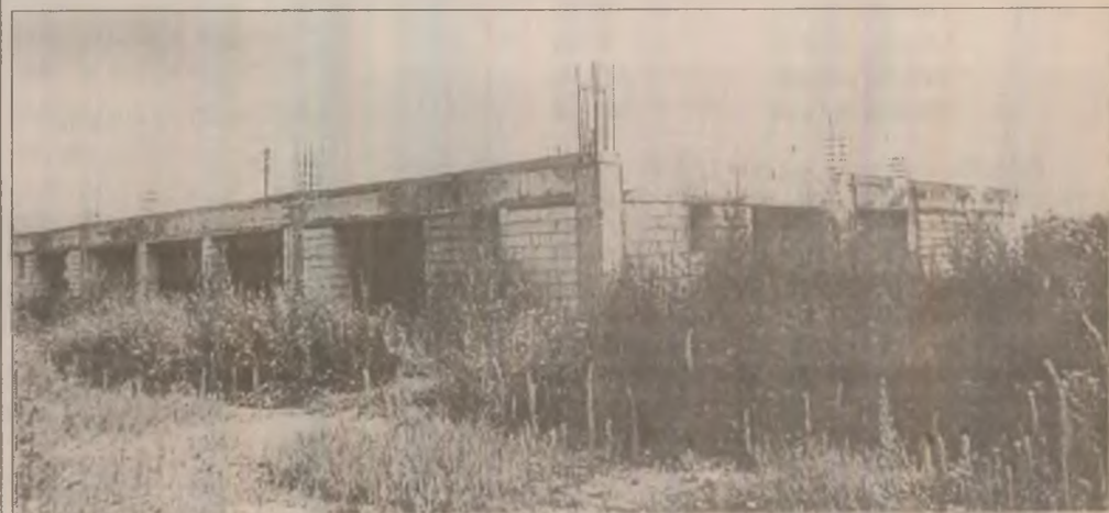
Cât timp va rămâne încremenit în acest stadiu de construcție căminul spital de bolnavi cronici și handicapați de la Brănișca? Numai Dumnezeu știe!