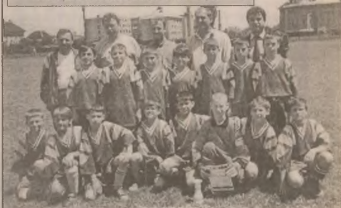
A.S. Tehno Sporting Simeria a ocupat locul III la ediția I a Memorialului "Nicu Capră"