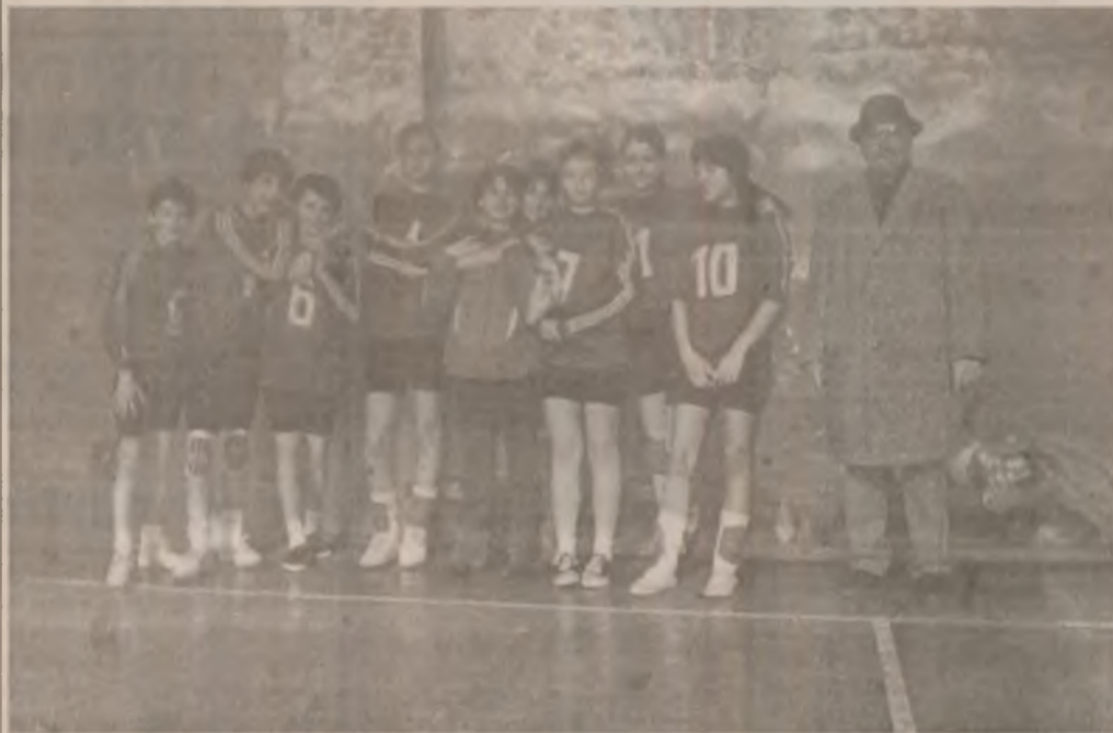
Lotul CSS Deva, proaspătă vicecampionă națională la volei, comportament remarcabil în majoritatea întâlnirilor avute.