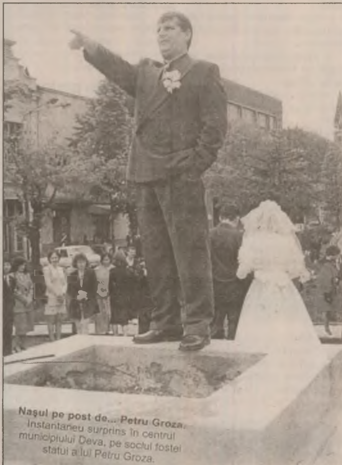
Nașul pe post de... Petru Groza. Instantaneu surprins în centrul municipiului Deva, pe soclul fostei statuii a lui Petru Groza.