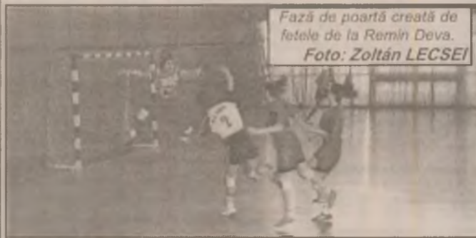
Fază de poartă creată de fetele de la Remin Deva.

Ieri a avut loc ședința tehnică organizatorică a grupării feminine de handbal din Deva, având ca scop aprobarea programului de pregătire, definitivarea lotului pentru noul sezon handbalistic. La ședință au participat întregul lot de jucătoare, antrenorii precum și conducătorii noii societăți non profit - Universitatea Remin Deva. Acesta va fi noul nume cu care echipa va juca în competițiile oficiale și amicale de acum înainte. S-a stabilit că obiectivul