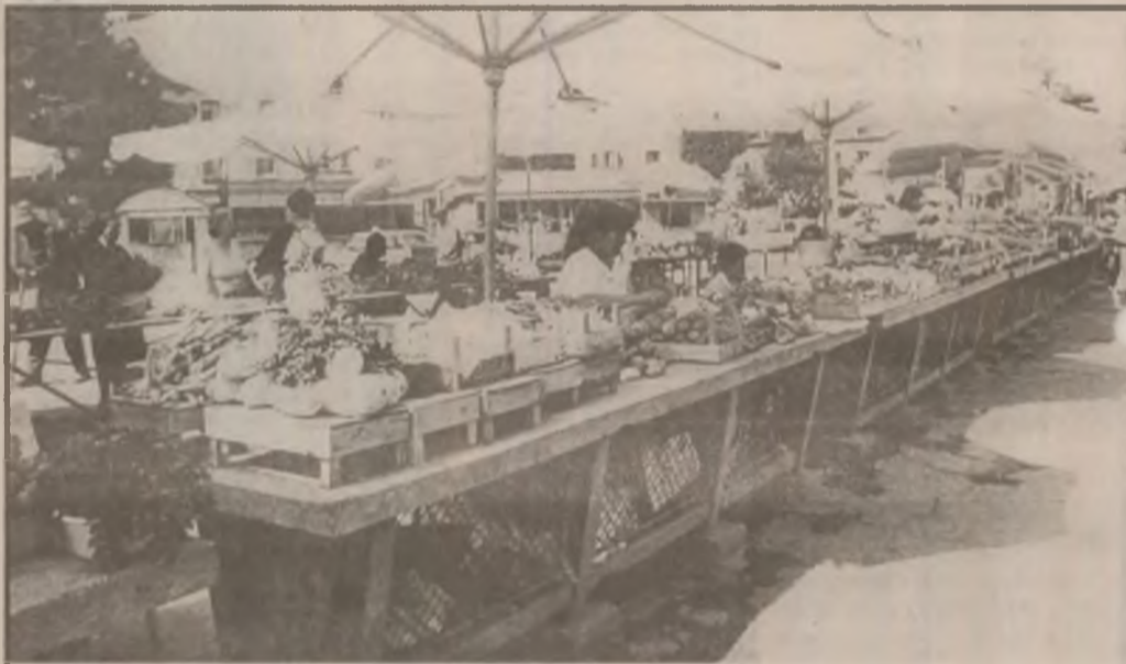
Piața agroalimentară Simeria. Un sortiment bogat de produse prezentat în mod civilizat.

Asupra obiectivului prioritar al liceului - încălzirea centrală - nu se mai pune problema din partea Consiliului local, pentru că anul acesta este prins în investițiile Ministerului Educației Naționale, fiind deja anunțată licitația pentru începerea lucrărilor, după cum afirma directorul liceului.