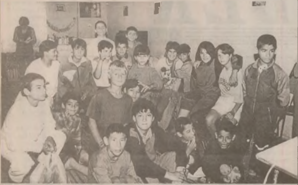
În lipsa unei tabere, copiii de la Școala Ajutătoare Săcel se mulțumesc și cu programele televizorului.