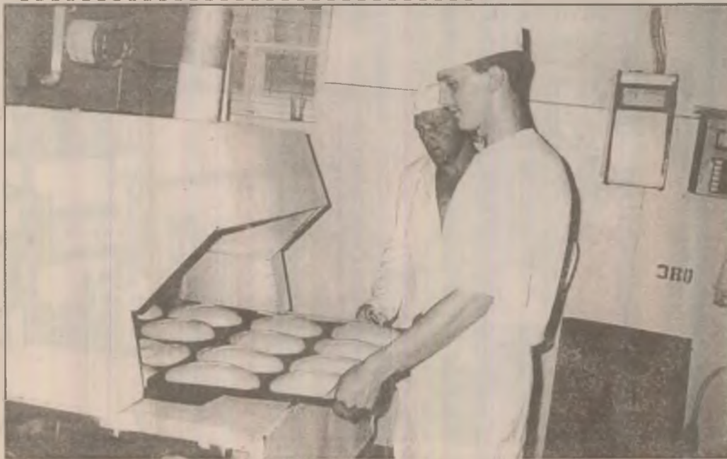
La S.C. Mobinpex Faur SRL Deva, pâine de bună calitate și la prețuri fără concurență.

P.S. În ultimele zile, drumul spre blocul I s-a mai netezit. Cineva a șoptit ceva cuiva.