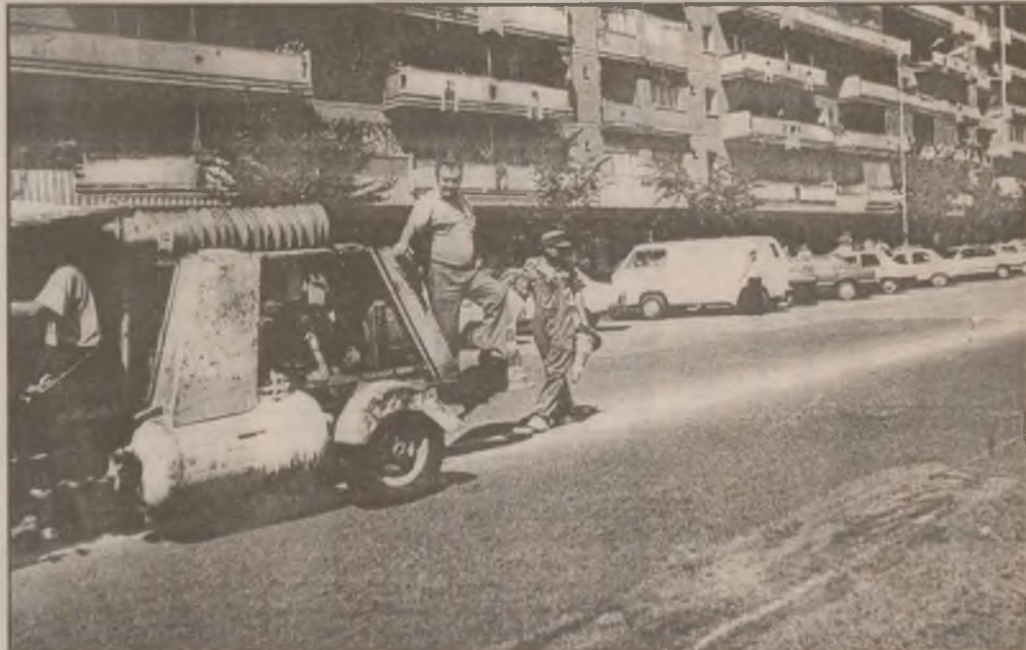
După frezare și asfaltare o echipă a Primăriei Deva execută marcarea bulevardului.