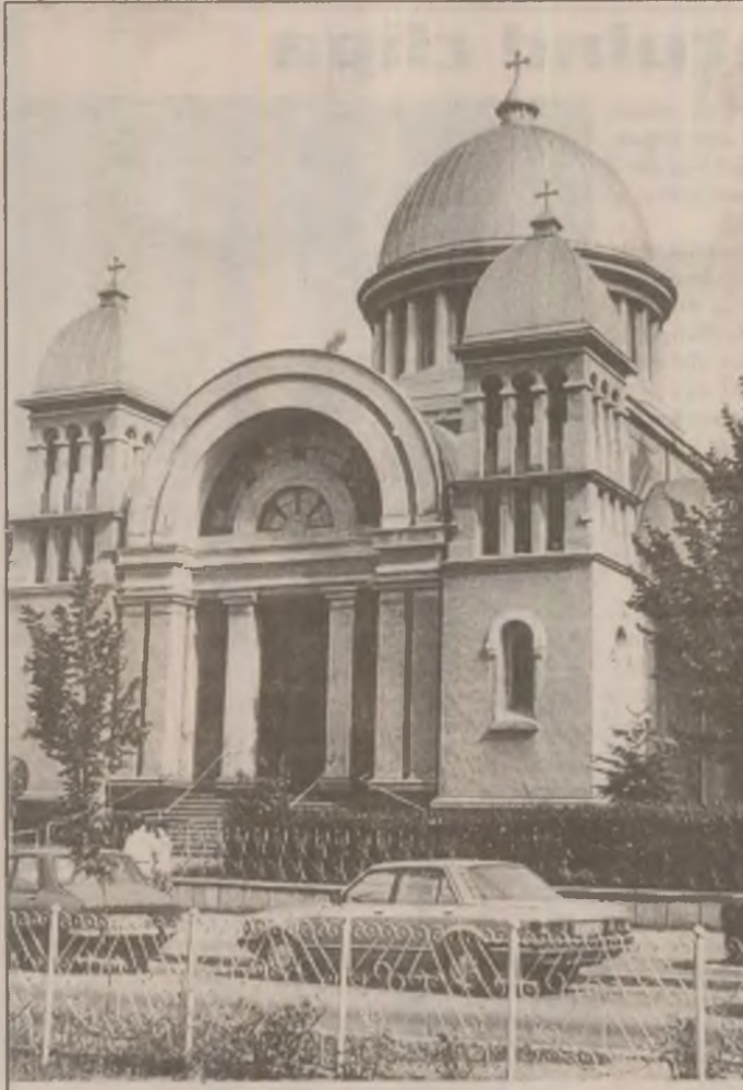
Deva. Biserica ortodoxă Bunavestire de pe strada Libertății.

Între gândurile de viitor ale patronilor firmei Mobinpex Faur SRL Deva - este și acela de a ieși pe piața externă cu produse - în această idee existând deja mai multe contacte cu parteneri din Austria și Italia ce s-au arătat interesați în prelucrarea lemnului.