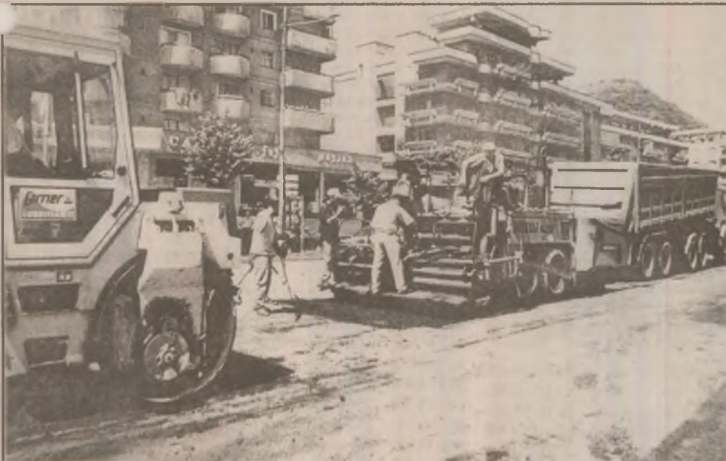
Drumarii și-au sărbătorit ziua prin muncă. Aspect din timpul turnării asfaltului pe porțiunile frezate - lucrare executată de CONTRANSIMEX SA pe bd. Decebal din Deva.

beton a platformei. Surata ei însă, cea "amplasată" mai aproape de stația CFR, își forța lanțul legat de șină, alungându-și cu coada muștele ce roiau în jur, abia răsuflând, însetată, sub soarele dogorător. "Zi de zi le aduc aici", le plâng de milă trecătorii. Oare ce-or fi gândind stăpânii? (L.L.)