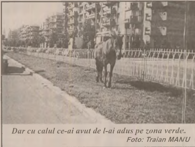
Dar cu calul ce-ai avut de l-ai adus pe zona verde.