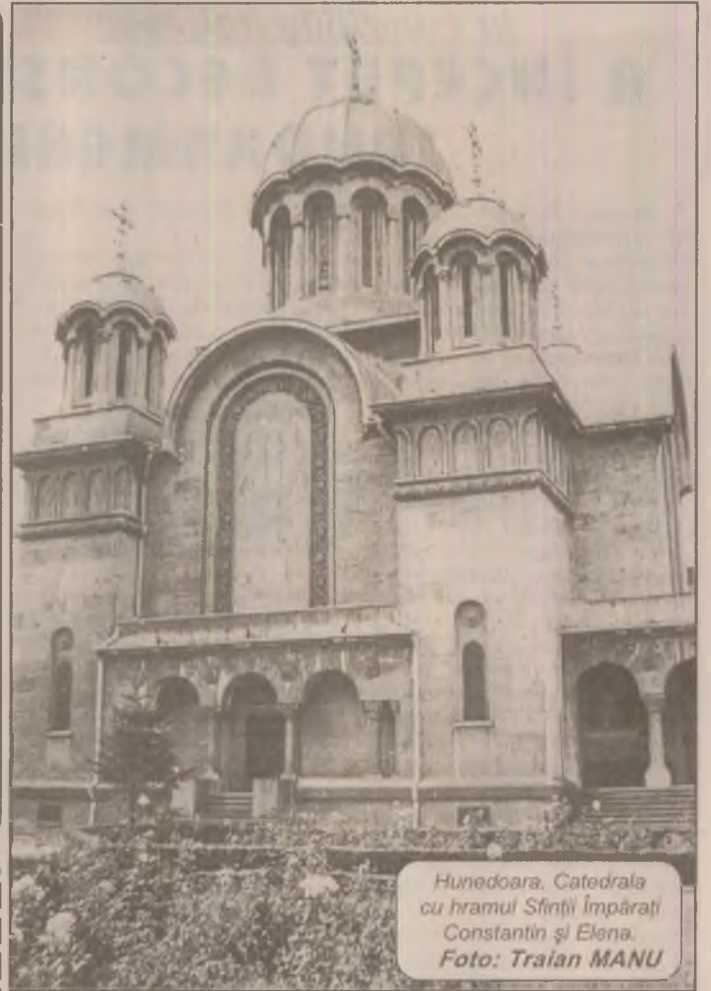
Hunedoara. Catedrala cu hramul Sfinții Împărați Constantin și Elena.

Dumneavoastră ce spuneți, stimați cititori din Hunedoara? Să renunțăm a vă informa pentru că le este greu unora să respecte programarea?