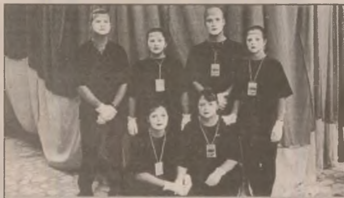
Grupul de mimi Black versus white (Negru contra alb) care a participat la spectacolul de la Deva al grupului B.B.H. din Belfast, Marea Britanie, cu momente din Biblie .