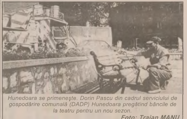
Hunedoara se primenește. Dorin Pascu din cadrul serviciului de gospodărire comunală (DADP) Hunedoara pregătind băncile de la teatru pentru un nou sezon.

Articolul 2 al hotărârii precizează că pentru veniturile anuale realizate conform prevederilor art.1 (prezentat anterior) se aplică o cotă de impozitare de 15 la sută; plata impozitului se va face trimestrial.