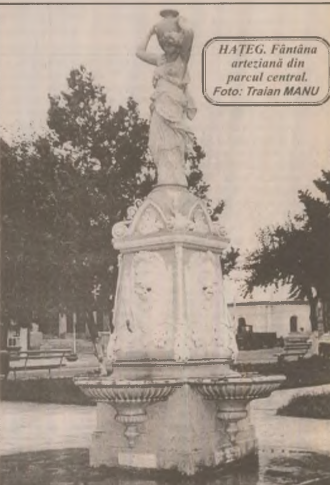
HAȚEG. Fântâna arteziană din parcul central.

dului" se desfășoară duminică, începând cu ora 13,30, pe Platoul Lacuri din satul Obârșă (comuna Tomești). Olarii din Obârșă, renumiți pentru ceramica lor, mai ales utilitară, vor fi gazdele ospitaliere (cum sunt moșii de obicei!) pentru cei ce participă la sărbătoarea lor cu gândul să-și procure oale și străchini, să se bucure alături de ei de manifestările cultural-artistice pregătite de Primăria Tomești, în calitate de organizator. (V.R.)