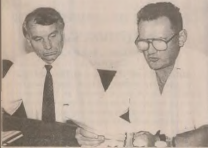
Primarul și viceprimarul Orăștiei la întâlnirea cu ziariștii.