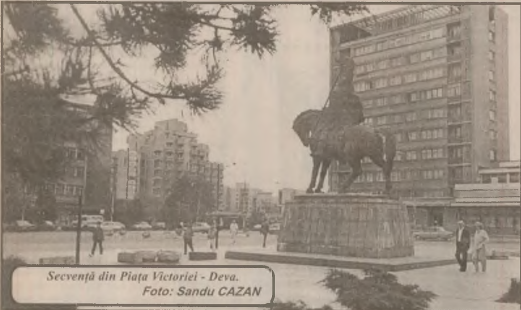
Secvență din Piața Victoriei - Deva.

Pentru a redresa, totuși, mineritul, este nevoie să fie luate măsuri realiste, să știm în ce direcție trebuie să se îndrepte acest sector, ținând seama de creșterea productivității muncii, de reducerea costurilor și de găsirea unor soluții alternative pentru încadrarea disponibilizărilor. Până acum s-au schimbat câțiva miniștri la industrie, dar problemele grave în sector au cam rămas aceleași. Poate de acum încolo, pe baza unor programe mai bune, se va face restructurarea mineritului, care va aduce roadele așteptate de multă vreme.