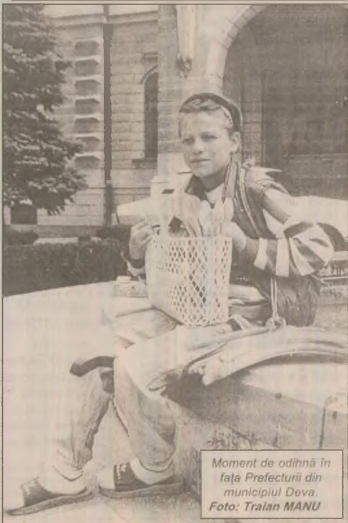
Moment de odihnă în fața Prefecturii din municipiul Deva.