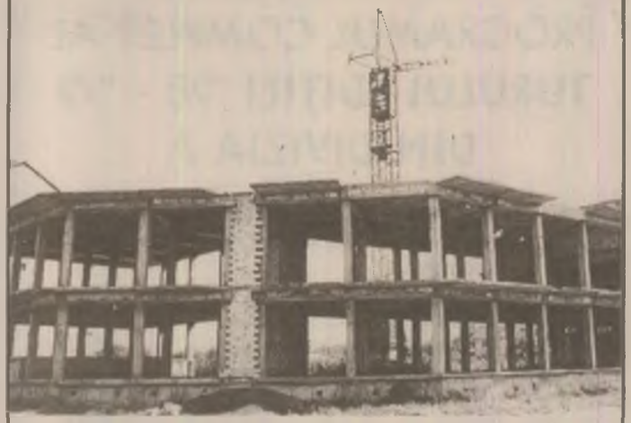
La Ilia macaraua stă înțepenită de la Revoluție încoace și tot așa și ridicarea noilor construcții.

Banca Europeană de Investiții acordă României 225 de milioane de ECU pentru reabilitarea drumurilor. Acordul de împrumut a fost semnat săptămâna trecută între reprezentanții ai Administrației Naționale a Drumurilor și ai BEI. Creditul este destinat celei de a treia etape a programului de reabilitare a drumurilor naționale din țara noastră, etapă prevăzută a se realiza în perioada 2001-2006. Etapa a treia include reabilitarea a peste 2000 de kilometri de drumuri naționale și necesită aproximativ 1,5 miliarde de dolari.