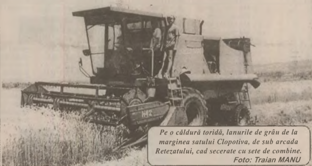
Pe o căldură toridă, lanurile de grâu de la marginea satului Clopotiva, de sub arcada Retezatului, cad secerate cu sete de combine.

În zonele ceva mai reci din județ, recoltatul grâului se realizează cu sârg în aceste zile. Joia trecută ne-am aflat în zona Râu Mare - Retezat, sperând să fugim puțin de căldură. Termometrul arăta însă 30 de grade la umbră. Dar oamenii lucrau în câmp. Ne-am oprit la Clopotiva. În zona Câmpșor, un grup de vreo opt persoane se adăposteau de razele fierbinți ale soarelui la umbra palidă a câtorva copaci mărunți. Vorbeau de una, de alta,