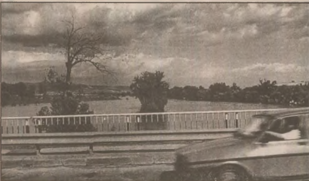
Podul peste Mureș dintre Deva și Șoimuș într-un moment când natura era pe punctul să se dezlănțuie iar apele atingeau cote ridicate.