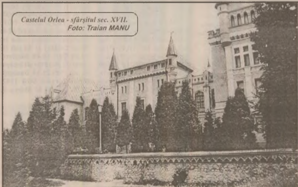
Castelul Orlea - sfârșitul sec. XVII.

În paginile 4 - 5 ale ziarului Proiectul Legii privind restituirea în natură sau prin echivalent a unor imobile preluate de stat după 6 martie 1945