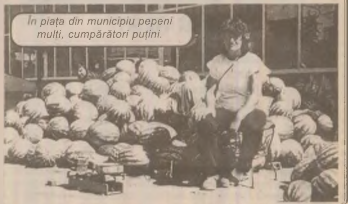
În piața din municipiul pepeni multi, cumpărători puțini.

N-am negociat, dar am văzut un cumpărător care a scos o pălărie cu 10000 lei. Preț bun pe căldura asta a verii. O fi știind țiganul să completească paiele sau le-a luat de la cineva care știe? Treaba lui! În orice caz apariția în piață a țiganilor pe post de vânzători și chiar de gură cască este de natură să îngrijoreze.