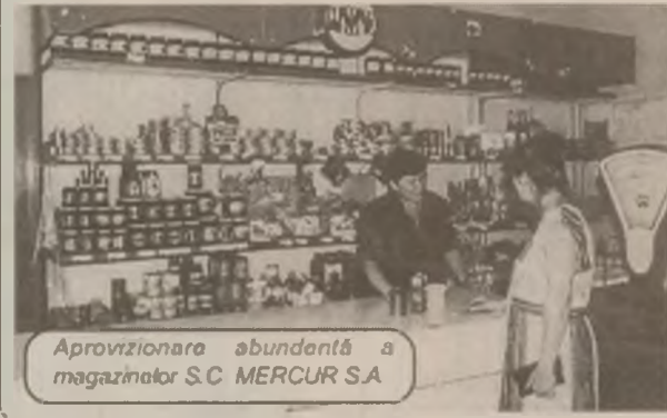
Aprovizionare abundentă a magazinului S.C. MERCUR SA

- Rezultatele pe care le obținem se datoresc tuturor colegilor mei, dar în special conducerii societății.