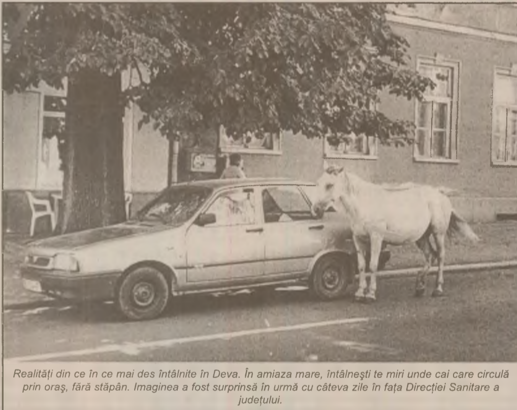
Realități din ce în ce mai des întâlnite în Deva. În amiaza mare, întâlnești te miri unde cai care circulă prin oraș, fără stăpân. Imaginea a fost surprinsă în urmă cu câteva zile în fața Direcției Sanitare a județului.

Deși a avut și efecte benefice, permițând păstrarea a 30.000 de angajați, această reducere a timpului de lucru a încurajat divorțurile în măsura în care ea lasă cuplurilor mai mult timp liber, dar și mai puțini bani de cheltuit, concluzionează autorii studiului.