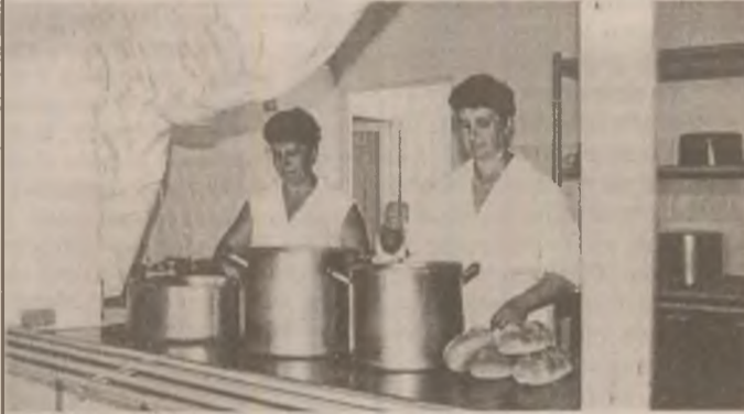
Mâncarea este foarte bună la cantina de ajutor social din Orăștie. În câteva minute, se va transfera din aceste vase emailate în sufertașele abonaților.

"Dinamica" sărăciei are multe expresii într-o comunitate umană.