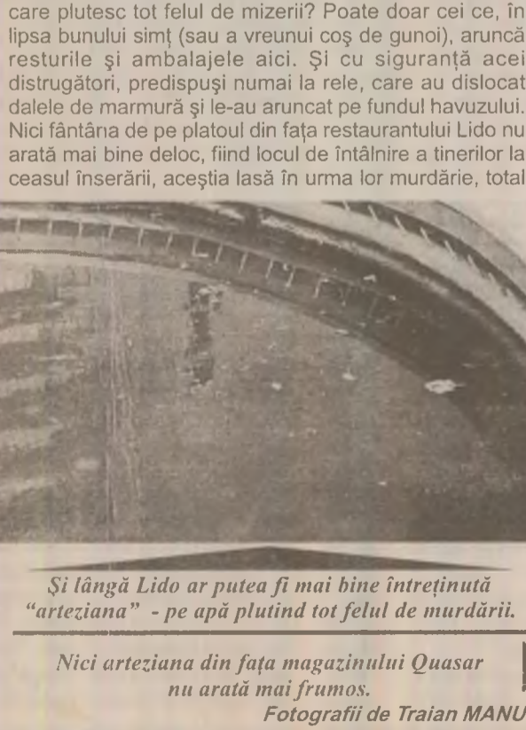
Și lângă Lido ar putea fi mai bine întreținută "arteziiana" - pe apă plutind tot felul de murdării.

Nici arteziiana din fața magazinului Quasar nu arată mai frumos.