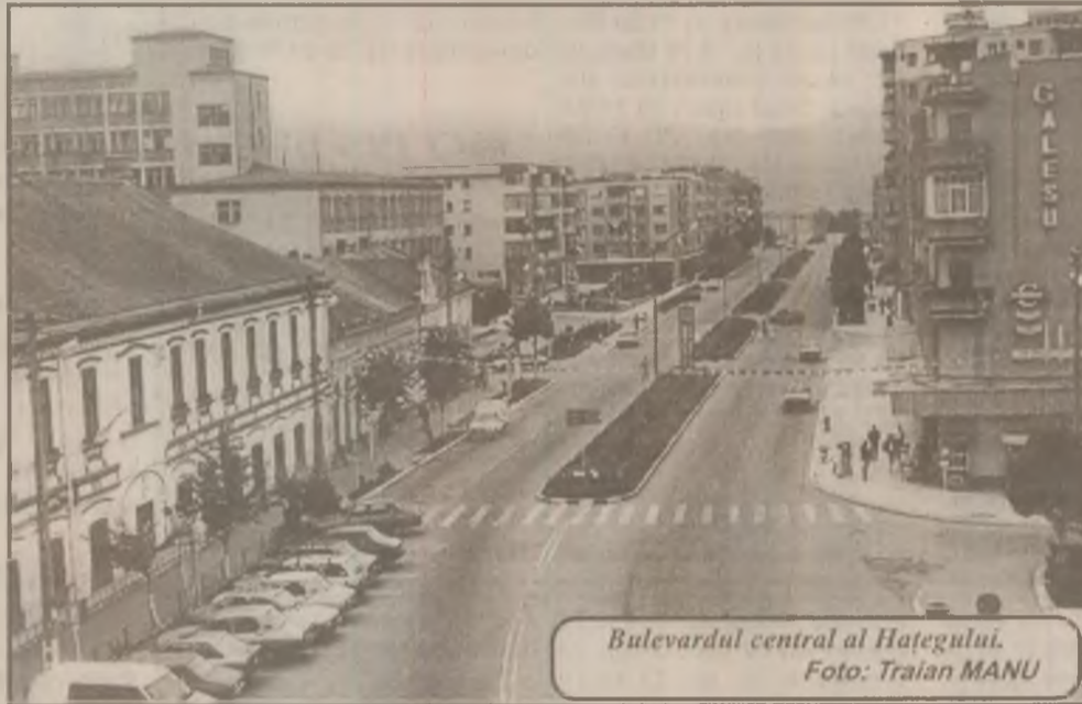
Bulevardul central al Hațegului.

În prezent, în depozitele COMCEREAL Hunedoara se află doar 300 de tone de grâu în timp ce capacitatea acestora este de 300 de mii de tone. Directorul COMCEREAL Hunedoara, Cornel Nemet, susține că societatea nu își poate permite să achiziționeze cantități mari de grâu pentru că nu îl poate valorifica.