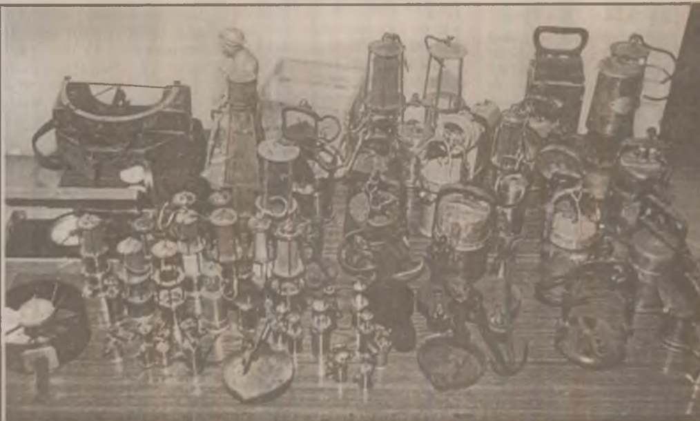
Colecția de lămpi de mină a fost una dintre cele remarcate la ediția a IX-a a EXPO-MINERIT.