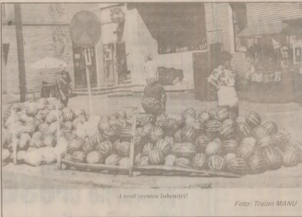
A sosit vremea lubenitei!