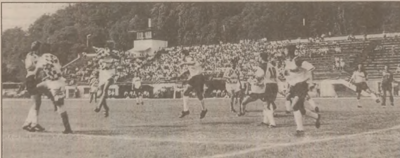
Devenii s-au aflat deseori în careul echipei F.C. Drobeta Tr. Severin, dar fără rezultat pe tabela de marcaj.