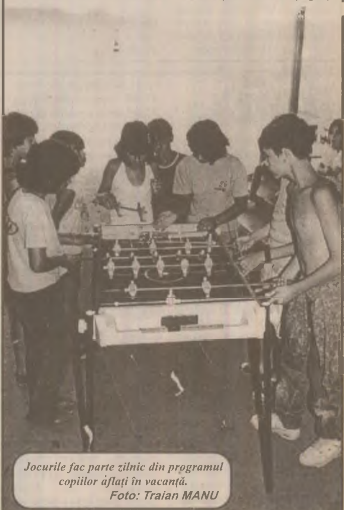
Jocurile fac parte zilnic din programul copiilor aflați în vacanță.