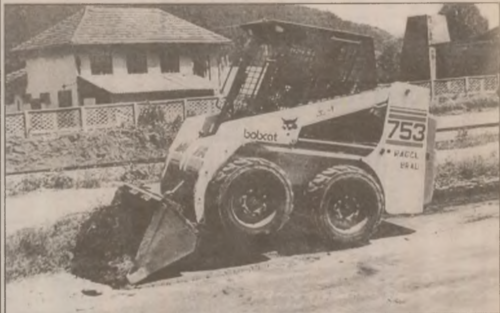
Recent a fost achiziționat un Bobcat, utilaj ce execută 28 de operații în sistemul de gospodărire comunală și locativă.