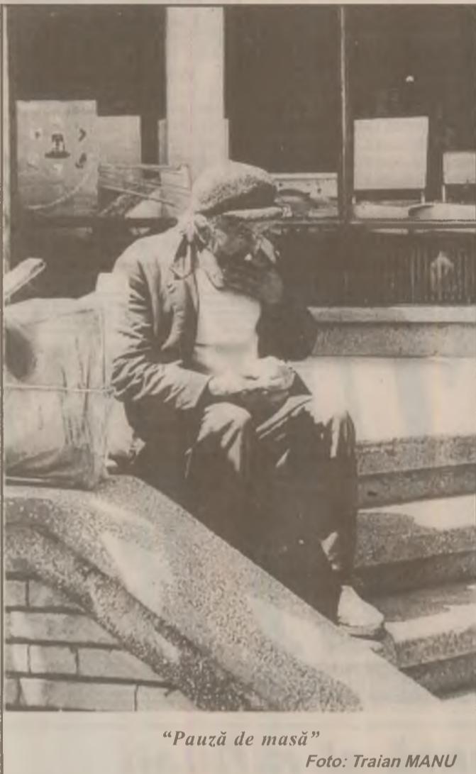
"Pauză de masă"

Ministrul Turismului, Sorin Frunzaverde, a arătat că programul inițiat de ministerul pe care-l conduce va avea finanțarea necesară, de la Fondul de Promovare și Dezvoltare în Turism, care se ridică la aproximativ 12 miliarde de lei.