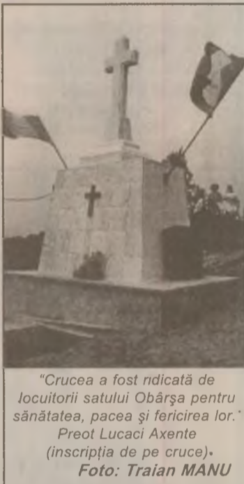
"Crucea a fost ridicată de locuitorii satului Obârșă pentru sănătatea, pacea și fericirea lor." Preot Lucaci Axente (inscripția de pe cruce).