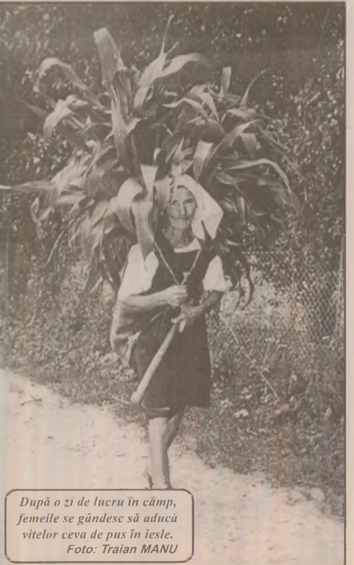
După o zi de lucru în câmp, femeile se gândesc să aducă vitelor ceva de pus în iesle.

În 1952, George VI a murit, pe tron urcând fiica lor, actuala Regină Elisabeth II.