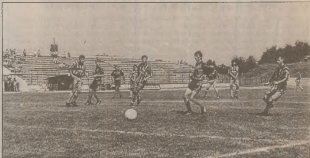
Fotbaliștii din Călan au început bine noul campionat în care doresc să se claseze pe primul loc în clasament. Fază din meciul Victoria Călan - Minerul Aninoasa.