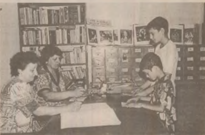
Imagine surprinsă la Biblioteca Municipală din Orăștie, care va aniversa în acest an împlinirea unei jumătăți de secol.

În asemenea condiții, e de la sine înțeles că absența "ofertei" unei săli de lectură e tot mai mult resimțită la Biblioteca Municipală din