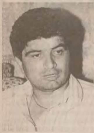
Tânărul și dinamicul director general al S.C. „FAVIOR” SA Orăștie privește cu încredere înainte, spre noi realizări

Ne-am aflat pentru a doua oară în ultimele patru luni la SC „Favior” SA Orăștie. Unitatea este integral privatizată. Din decembrie 1996. De atunci, cursul ei, în vâltoarea economiei de piață, este altul, unul pozitiv. Noul consiliu de administrație a reorganizat structurile de producție, aprovizionare, desfacere, pedalează cu insistență și exigență pe profesionalism, disciplină și calitate, a pus fabrica în competiție dură cu economia modernă.