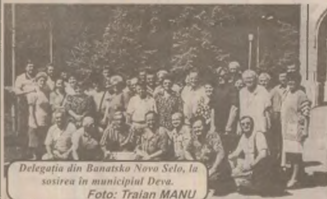
Delegația din Banatsko Novo Selo, la sosirea în municipiul Deva.

Așa cum informam în numărul de sâmbătă al cotidianului nostru, la sfârșitul săptămânii trecute o delegație a Comunității Românilor din Satul Nou (Banatsko Novo Selo - Iugoslavia) s-a aflat timp de trei zile (14-16 august) în județul nostru, la invitația