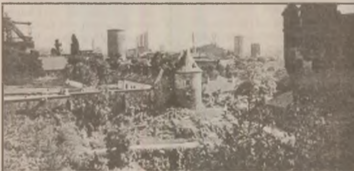
HUNEDOARA. Cetatea de foc văzută din Castelul medieval al Corvineștilor.