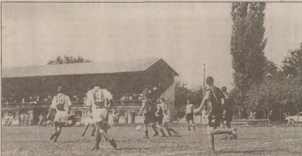
CFR Marmosim Simeria se anunță un adversar de temut pentru ocuparea unui loc de frunte în clasament. Secvență din partida cu Metalul Crișcior.

3 Vasveni - Satu Mare - 7 puncte cu 6170 kg pește prins.