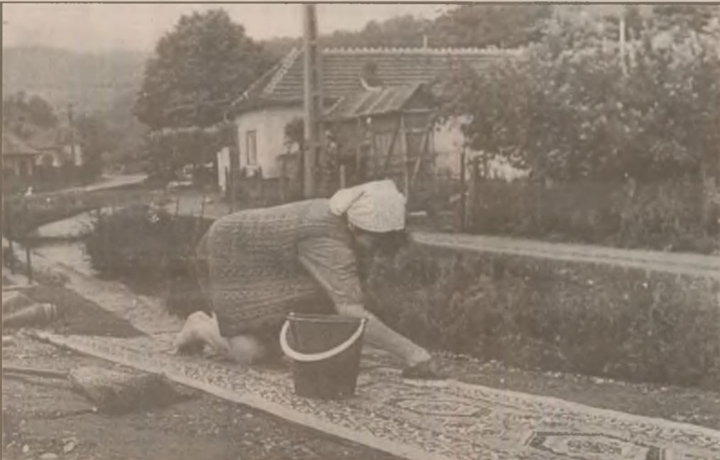
Așa se curăță covoarele la Bobilna.

Vitaminele le putem dobândi prin alimentație dar pielea și le poate lua și din produsele cosmetice, în special creme, care le conțin. Aceste creme acționează lent, pe termen îndelungat (efectele încep să apară după 6-9 luni). Cu răbdare și cu o dietă echilibrată (să nu uităm că pielea e „oglinza” sănătății noastre!) vom reuși nu doar să ne redobândim vitalitatea ci și să ne păstrăm frumusețea.