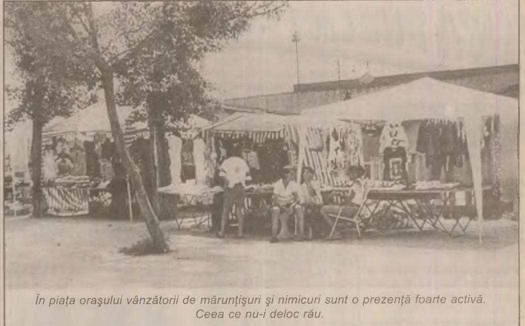
În piața orașului vânzătorii de mărunțișuri și nimicuri sunt o prezență foarte activă. Ceea ce nu-i deloc rău.

- Are. Chiar zilele trecute am achitat ajutoare sociale pe luna iulie în valoare de 26,8 milioane de lei și am distribuit bonuri de masă la cantina așa numită a săracilor, la 99 de oameni. Mai trist este că localitatea fiind mono-industrială, trăind pe seama combinatului siderurgic, care și-a restrâns mult activitatea, oamenii nu au speranță că lucrurile se vor îndrepta, că ei și copiii lor vor ajunge la un trai mai bun. Aceasta este realitatea, fie că ne place, fie că nu.