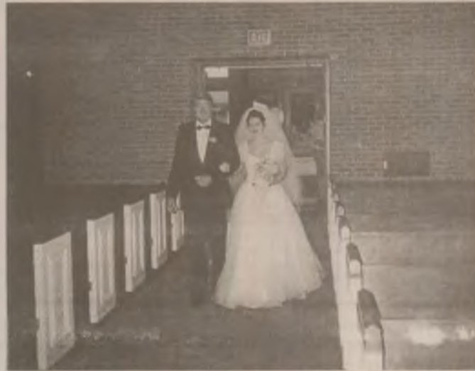
Bela însoțindu-și fiica spre... altarul fericirii.