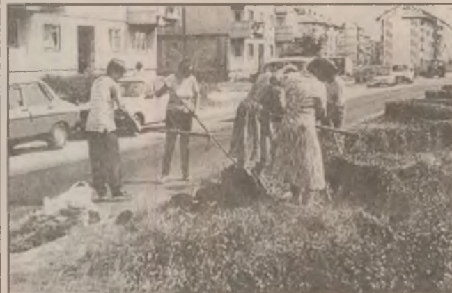
Pe strada Dorobanți din Deva, echipa condusă de Judith Nemes lucrează la întreținerea zonelor verzi.