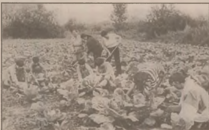
Copiii de la Școala ajutoare Săcel - Hațeg ajută după puterile lor la întreținerea grădinii școlii.